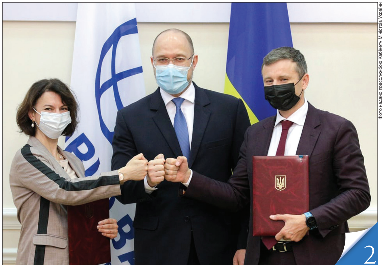
У присутності Прем'єр-міністра Дениса Шмигала документ підписали міністр фінансів Сергій Марченко та старший менеджер портфелю проєктів Світового банку в Україні Клавдія Максименко

СПІВПРАЦЯ. Наша держава отримає позику на політику розвитку в галузі економічного відновлення