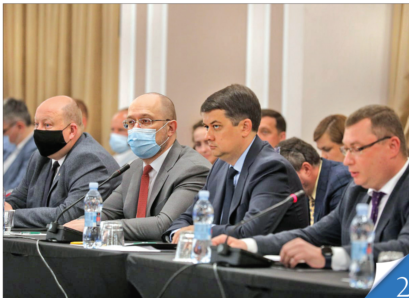
Прем'єр-міністр Денис Шмигаль привітав найавторитетнішу громадську інституцію з ювілеєм

ДУХОВНІСТЬ. Всеукраїнська Рада Церков і релігійних організацій відзначила чверть століття з дня заснування