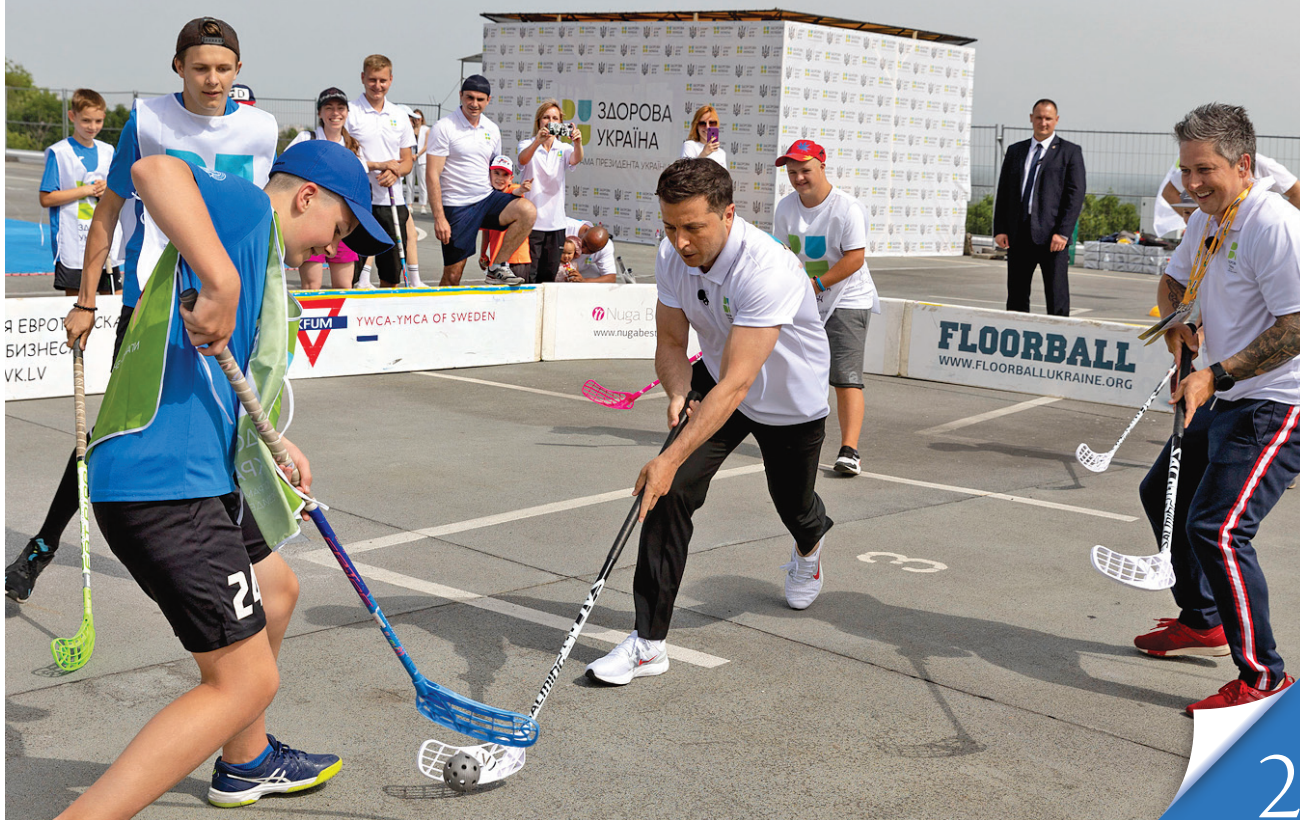
Програму спрямовано на всі вікові категорії та групи населення

ТУРБОТА. Стартувала програма Президента «Здорова нація», адже рух — то основа буття