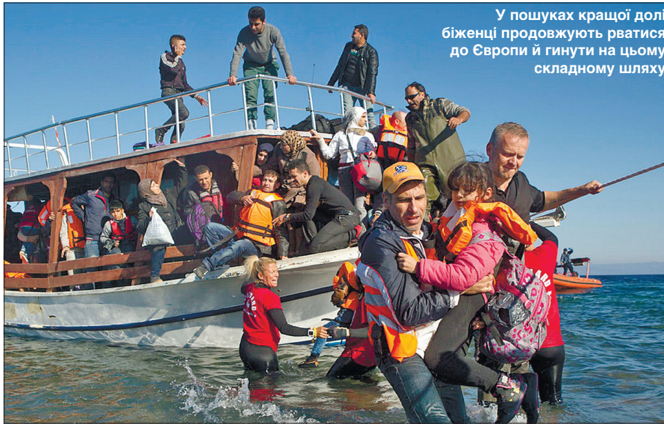
У пошуках кращої долі біженці продовжують рватися до Європи й гинуть на цьому складному шляху

Однак діти не єдині жертви нелегальної міграції. Згідно з даними UNITED, починаючи з 1993 року, кількість смертей серед мігрантів, котрі намагалися дістатися країни своєї мрії, становить майже 45 тисяч. Більшість із них потонула. Проте, за словами директора