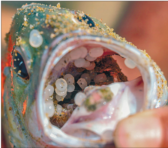
Приклади шкоди живій природі — у пащах спійманих в акваторії риби

відбуксувати якнайдалі в море, щоб мінімізувати забруднення, але це неможливо. Місцева еколог Аджанта Перера розповіла: якщо контейнеровоз потоне, це стане найгіршим екологічним сценарієм. «Цим небезпечним вантажем — азотною кислотою, іншими хімікатами й нафтою судно фактично повністю знищить усе живе на морському дні», — сказала вона.