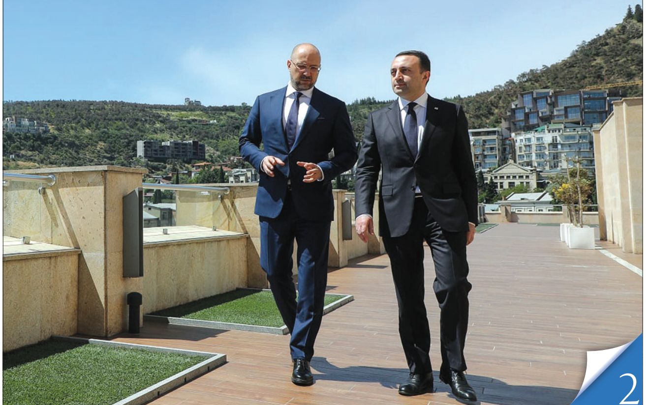
Прем'єр-міністри України та Грузії Денис Шмигаль та Іраклій Гарібашвілі: «Ключовий чинник, який об'єднує наші держави, — спільність європейських і євроатлантичних прагнень»

СПІВПРАЦЯ. Відносини між державами ґрунтуються на спільних економічних і європейських прагненнях