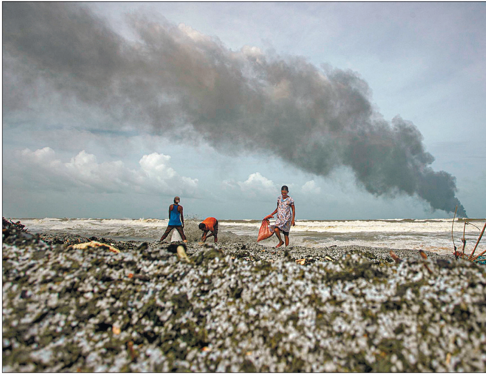
Шкоду довілля обраховуватимуть мільярдами доларів

Судно стоїть біля берегів і поступово тоне, його намагаються