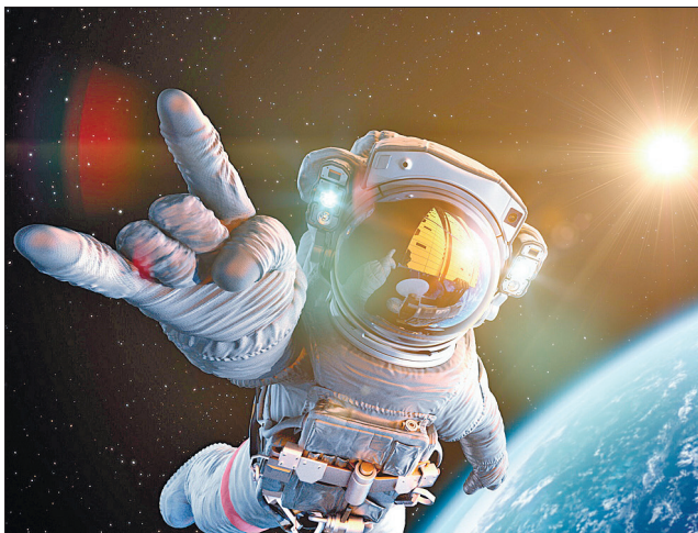
ESA закликає жінок подавати заявки на участь з набору майбутніх європейських астронавтів

ESA закликає жінок подавати заявки на участь, але в агентстві наголосили, що не