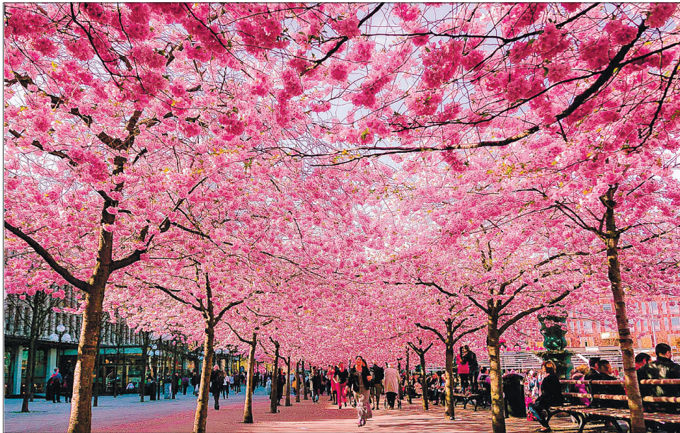
З нагоди цвітіння сакури в містах країни влаштовують фестивали

Японське метеорологічне агентство, яке щороку подає прогноз появи перших квітів на вишневих деревах і піку сезону цвітіння, стежить за 58 сакурами