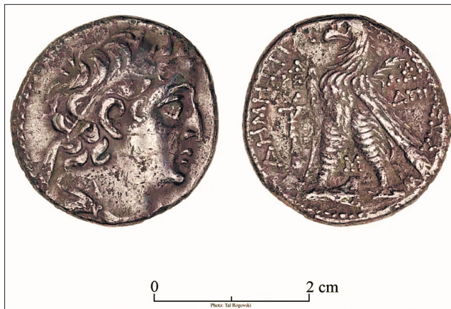
В Єрусалимі знайшли монету біблійних часів

Срібні монети, як ця, традиційно називають «тірійський шекель». Ними користувалися в період Другого храму, їх че-