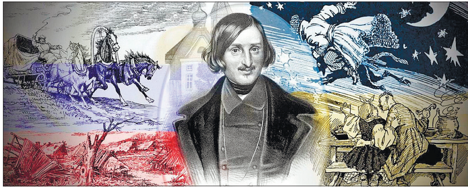
У «Вибраних місцях із листування з друзями» Микола Гоголь обгрунтовано заперечує месіанську роль Росії

«Це мовби репереклад, переклад з перекладу, начебто ранні свої твори Гоголь чув і «уловлював» спершу українською, а вже тоді перекладав їх на папір по-російськи, перекладав з питомої мови своєї душі,