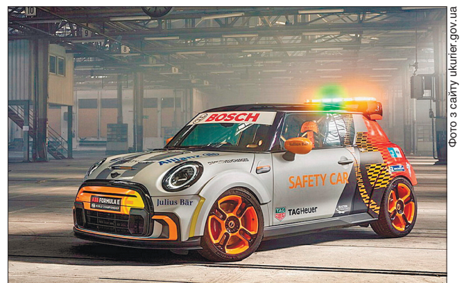
Новинка від Mini візьме участь у перегонах болідів Formula E 10 квітня

Максимальну швидкість електромобіля примусово обмежено 150 км/год. Комплект літій-іонних акумуляторів, встановлений під його підлогою, забезпечує пробіг від 235 до 270 кілометрів.