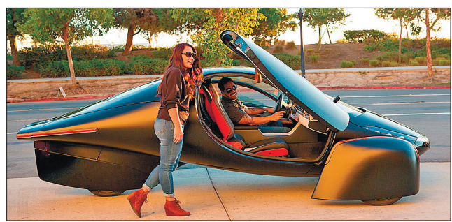
Триколісний електрокар з футуристичним дизайном матиме сонячні батареї і 100-кіловатний акумулятор

«Галузь потребує творчих розробок, щоб рухатися вперед. Я щасливий надати допомогу Aptera під час їх переходу до серійного виробництва», — сказав Манро.