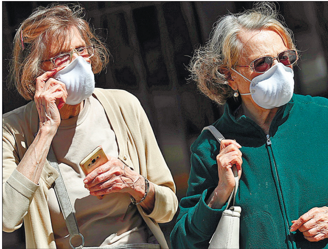
Раніше вважали, що повторне зараження — вкрай рідкісне явище, а нові дані змушують замислитися, вважають фахівці

«Легко знайти інформацію, що природна інфекція захищає від повторних заражень, — ідеться в дослідженні. — Але тільки 80% переохворілих стають захищеними, а серед