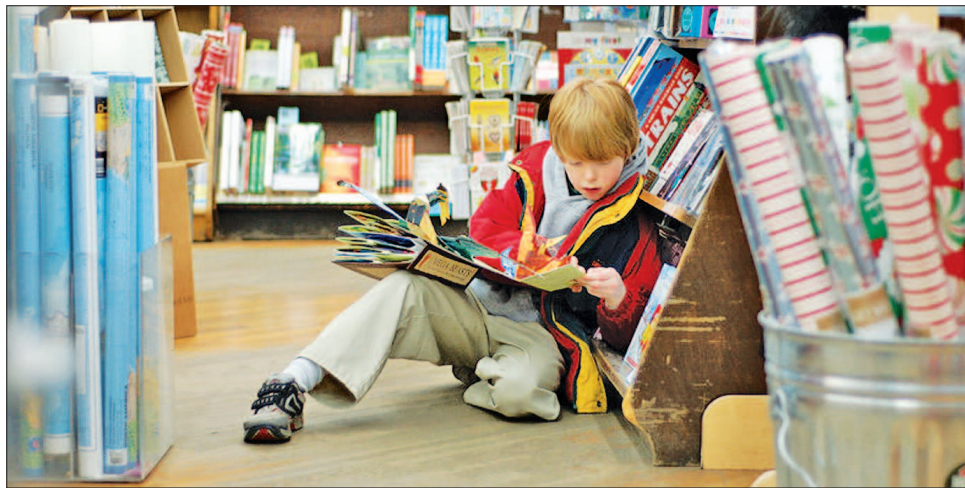
Тиждень читання відкрив для дітей цілий світ досі не пізаного

Однак такий стан речей негативно позначається на дитячому розвитку, адже,