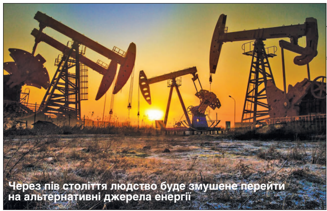
Через пів століття людство буде змушене перейти на альтернативні джерела енергії

На тлі пандемії коронавірусної інфекції й падіння попиту найбільші виробники нафти уклали угоду про рекордне зниження видобутку на 9,7 мільйона барелів на добу в межах угоди ОПЕК+, яка буде чинною два роки — з 1 травня 2020-го до початку травня 2022-го. Про скорочення домовилися і країни G20, які не входять в ОПЕК+, зокрема США і Канада. Внаслідок цього сумарне зниження видобутку в світі може становити приблизно 19 мільйонів барелів на добу, або майже 20%, вважають фахівці.