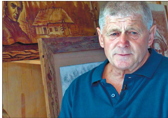
Василь Гелетко створив більш як тисячу картин, присвячених життю і творчості Тараса Шевченка