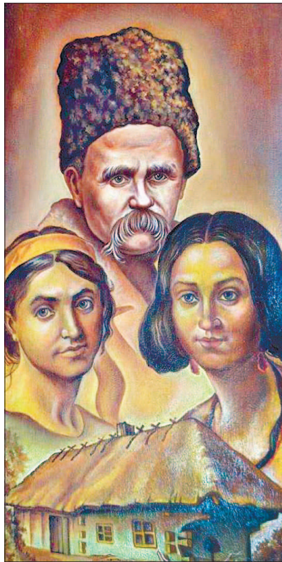
Образи жінок у житті Тараса стали темою багатьох робіт художника Василя Гелетка

сприяла цьому, наділивши вчителя пишними вусами, виразними бровами, відповідною формою голови. Та й сам його голос, акторська манера, уміння зі сцени донести до глядача думки й настрої твору, який виконував, — усе свідчить про те, що перед нами людина з неабиякими здібностями.