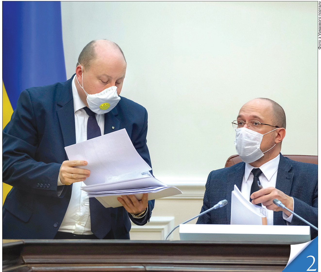
Упродовж року Кабінет Міністрів працював у надскладних умовах і з не баченою раніше інтенсивністю

РІК РОБОТИ КАБІНЕТУ МІНІСТРІВ. Ефективні рішення забезпечили державі стабільність і прогнозованість