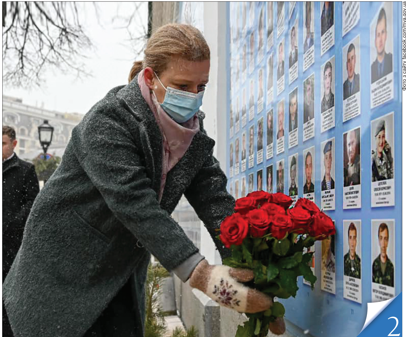
Напередодні Дня українського добровольця біля Стіни пам'яті на Михайлівській площі країна згадувала загиблих на сході України захисників-добровольців. Профільний міністр Юлія Лапунтіна була поруч із ветеранами та їхніми родинами

РІК РОБОТИ УРЯДУ. Міністерство у справах ветеранів відвітувало про зроблене впродовж означеного періоду