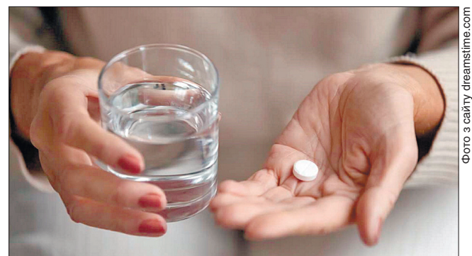
Вживання аспірину полегшує перебіг захворювання на COVID-19

Однак автори роботи зауважили, що дослідження попередні. Вони не ставили мету з'ясувати механізм дії аспірину на коронавірус. Фахівці зазначили, що пацієнти, які вживали аспірин, одужували швидше. Це пов'язують із протизапальними властивостями препарату.