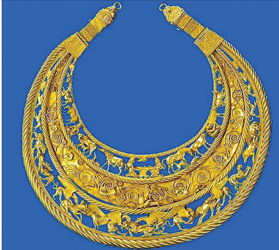
Пектораль скіфського царя з кургану Товста Могила є найціннішим експонатом історичного фонду дорогоцінних металів і дорогоцінного каміння України

Це відкриття дасть змогу науковцям інакше поглянути на народ, який населяв територію сучасної України багато століть тому. Не вар-