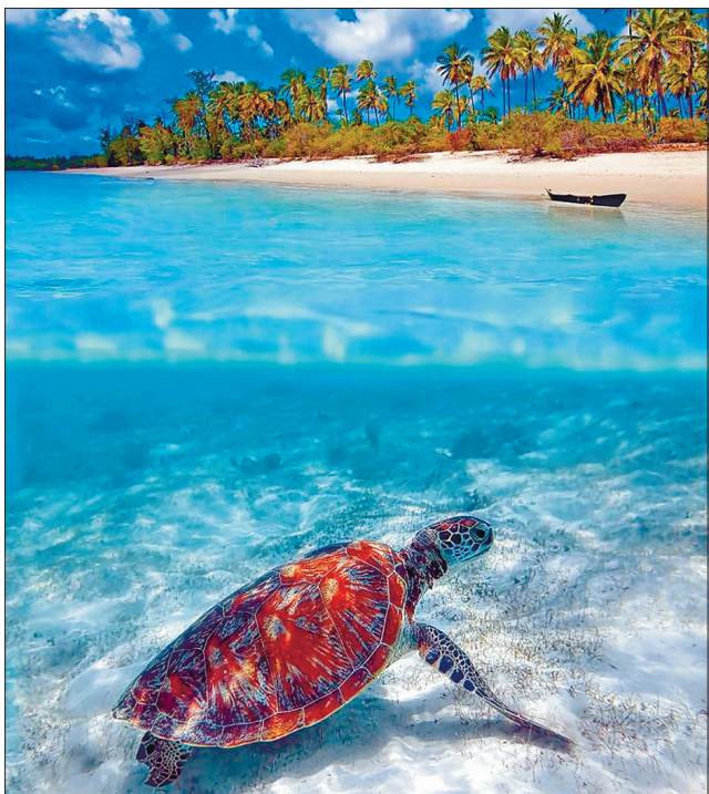
На Сейшельських островах лежить найменша суверенна держава Африки, площею 455 км², з населенням 82 тис. жителів

Автори дослідження оцінювали показники температури за так званим вологим термометром, який враховує не тільки градуси, а й рівень вологості. Тобто термометр накривають тканиною, що імітує стовідсоткову вологість. Щойно температура на мокрому термометрі досягає 35 градусів за Цельсієм, фактично зрівнявшись із температурою тіла, людина перестає пітніти, тобто охолоджуватися. Саме показники температури і вологості називають індексом тепла. Тіло людини не тільки реагує на температуру, для нього вкрай важливі показники вологості. Наприклад, у країнах з високою температурою й водночас висо-