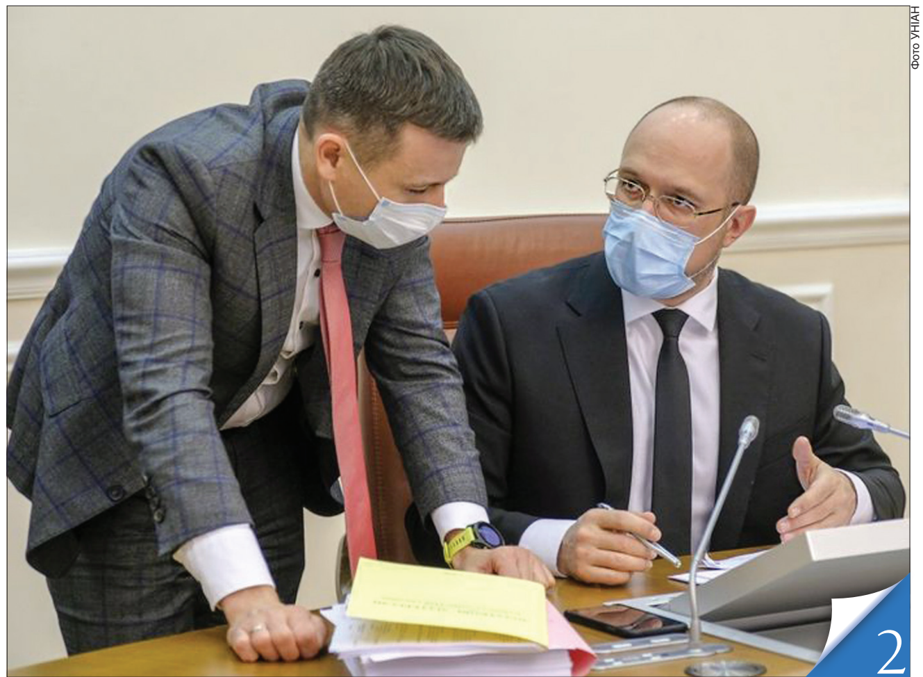
Міністр фінансів Сергій Марченко: за підсумками 2020 року надолужено не лише відставання від планових показників, а й перевиконано дохідну частину держбюджету на 54 мільярди. Цей тренд зберігається й цього року

РІК РОБОТИ УРЯДУ. У Міністерстві фінансів оприлюднили основні досягнення впродовж означеного періоду