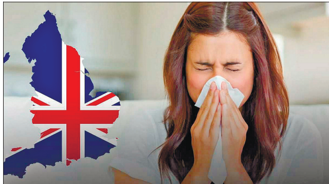
Британський штам коронавірусу швидко витісняє інші, бо агресивніше проникає у клітини

Щоб з'ясувати, як мутації штаму B.1.1.7 впливають на темпи поширення і тяжкість перебігу хвороби, науковці зробили комплексне комп'ютерне моделювання. Дослідження показало, що швидкість передачі британського штаму на 70% вища,