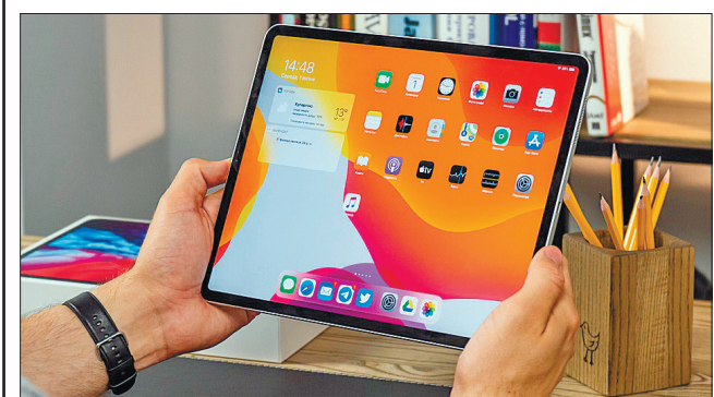
Важливою зміною стане екран iPad Pro. Фахівці прогнозують, що Apple перейде на технологію Mini-LED

Експерт розповів, навіщо гарнітурі змішаної реальності Apple потрібно стільки камер. Він зазначив, що вісім камер забезпечуватимуть візуалізацію доповненої реальності, тоді як шість відповідатимуть за інноваційну біометрію. І на решті остання камера потрібна для розпізнавання навколишнього середовища. Передбачають, що перший VR-шолом Apple побачить світ наступного року.