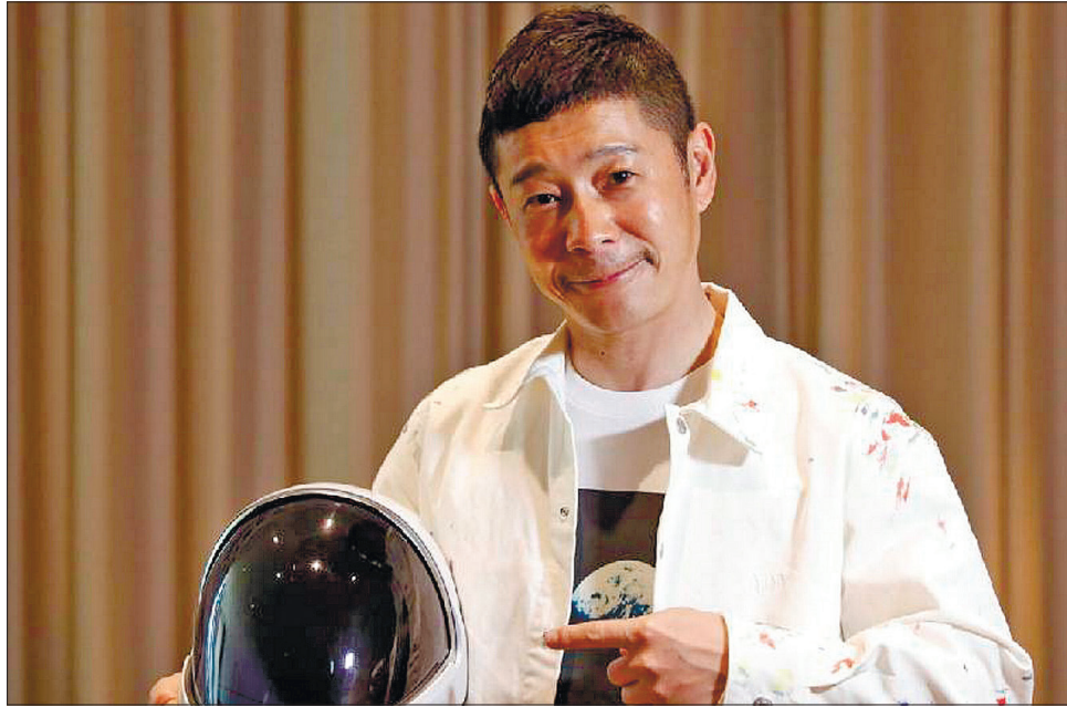
Юсаку Маедзава — японський мільярдер, засновник компанії Zozo, є 14-ю найбагатшою людиною в Японії

Спочатку колекціонер і великий шанувальник мистецтва Маедзава хотів запросити в космос шістьох художників з усього світу, щоб ті створили твір мистецтва після повернення на Землю, надихаючи інших на польоти в космос. Але потім переглянув цю ідею і розширив пошук до представників будь-яких професій. Від потенційних туристів потрібно тільки дві якості: бути творчою осо-