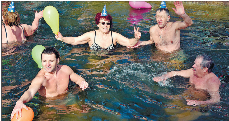
Емоції спільного занурення моржів «Я в серці маю те, що не вмирає», присвяченого 150-річчю із дня народження Лесі Українки

Чи не постійний учасник усіх заходів тернопільських моржів