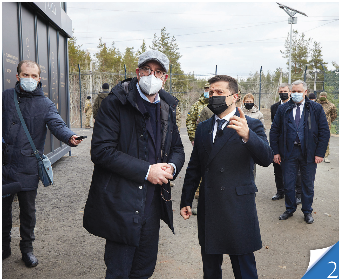
Президент Європейської Ради Шарль Мішель і Володимир Зеленський побували на КПВВ «Щастя» в Луганській області

ЦИВІЛІЗАЦІЙНИЙ ВИБІР. ЄС підтримує Україну не лише у врегулюванні конфлікту на Донбасі, а й у проведенні судової реформи та вдосконаленні судової системи