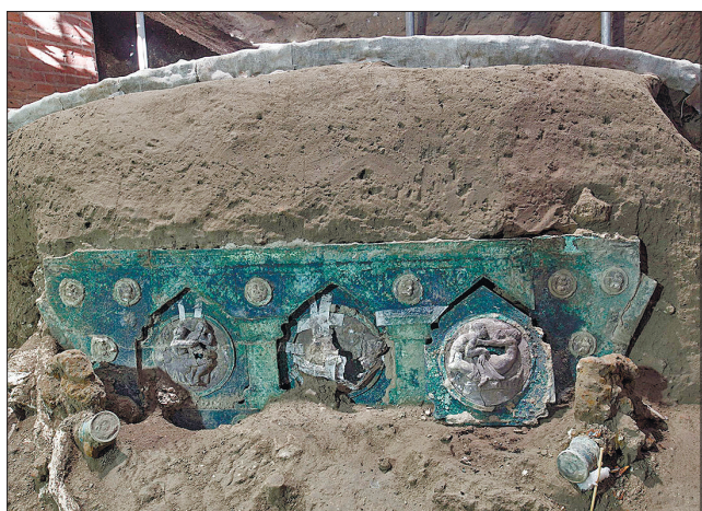
Задня спинка карети

Невелика карета розміром 0,9х1,4 м має чотири високі за-