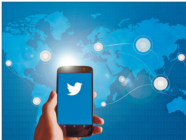
Twitter, який працює із 2006 року і зафіксував перший щорічний прибуток лише 2018-го, заявив, що сподівається подвоїти доходи 2023-го

Super Follow буде доступною за допомогою місячної передплати за 5 доларів США (майже 140 гривень), завдяки якій передплатник отримуватиме доступ не тільки до унікального контенту, а й матиме інші переваги, наприклад значок прихильника або доступ до товариства. Також передбачено спеціальні твіти для суперфоловерів. Але такі пости зможуть переглядати та відповідати на них тільки передплатники Super Follow. Нагадаємо, що фоловер — це користувач соцмережі, що стежить за оновленнями статусу чи новинною стрічкою іншого користувача. Поки що не відомо, кому саме буде доступна нова функція і коли буде відкрито Super Follow.