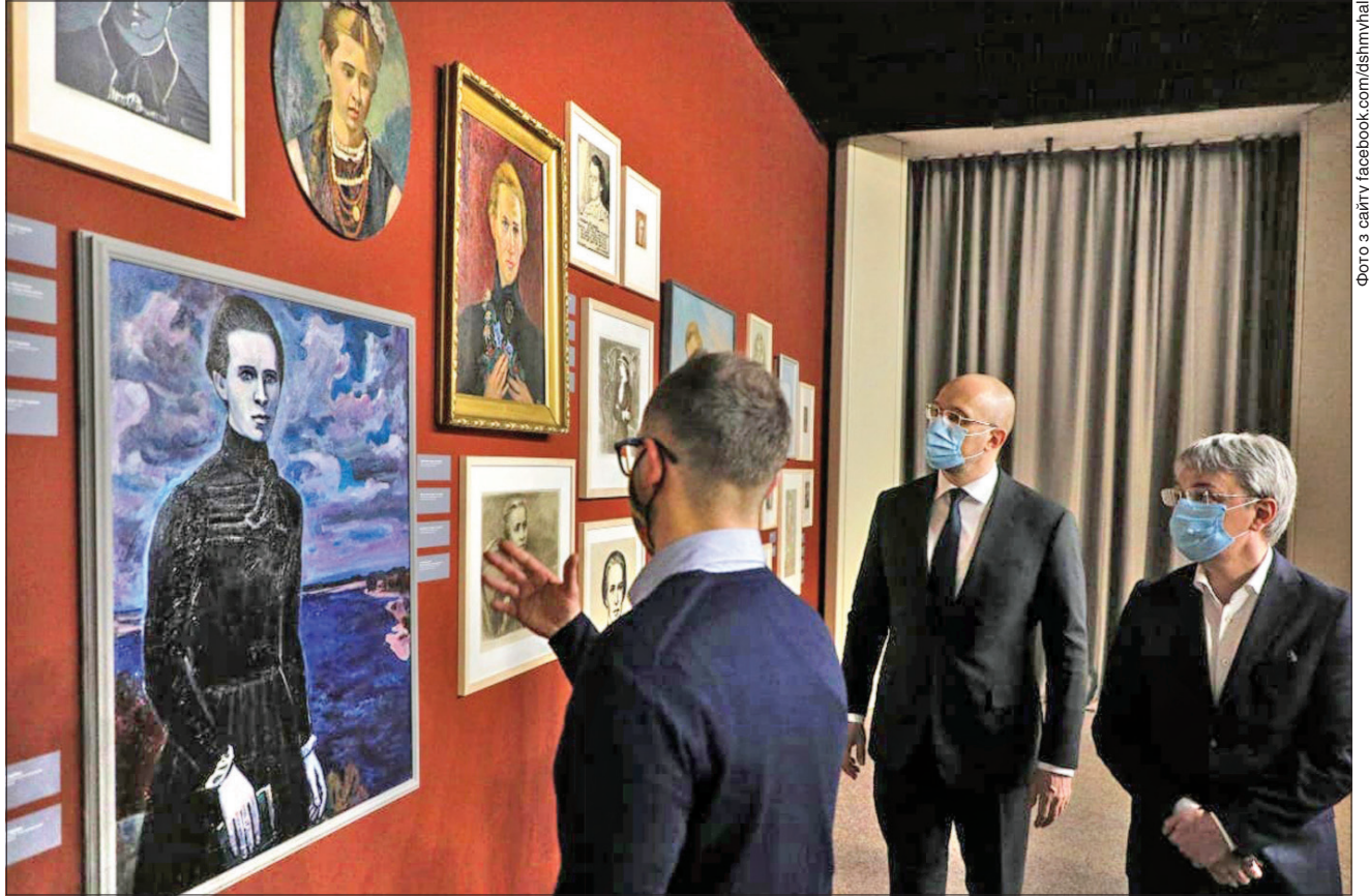
Ювілейна виставка, присвячена 150-річчю із дня народження Лесі Українки, вразила Прем'єр-міністра Дениса Шмигалья досі не відомими фактами з життя й творчості письменниці

СЛОВОМ І ДІЛОМ. Якщо любитимемо Україну так, як її любила Леся, будемо вільною державою