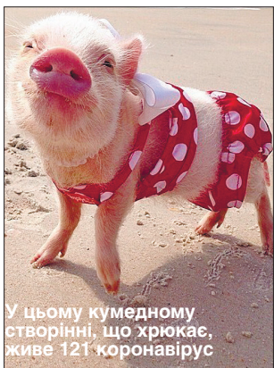
У цьому кумедному створінні, що хрюкає, живе 121 коронавірус

вірусів є ближчі й даліші види, і коронавіруси тут не виняток. Два близьких коронавіруси з великою ймовірністю можуть інфікувати один і той самий вид тварин. Такий аналіз робили не вручну, а за допомогою алгоритмів.