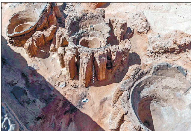
Посуд, в якому варили пиво

за умови централізованого і спеціалізованого виробництва пива важко відрізнити броварню від пекарні, оскільки і там, і там є печі, обпалене зерно, глиняні глеківки.