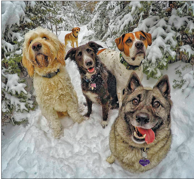
Собаки різних порід чудово впоралися з виявленням хворих на COVID-19

«Собаки здатні виявляти рак, діабет, малярію, хворобу Паркінсона та інші недуги, це задокументовано і науково підтверджено, — каже Ді-жер Джункейра, автор дослідження. — Нові роботи перед-