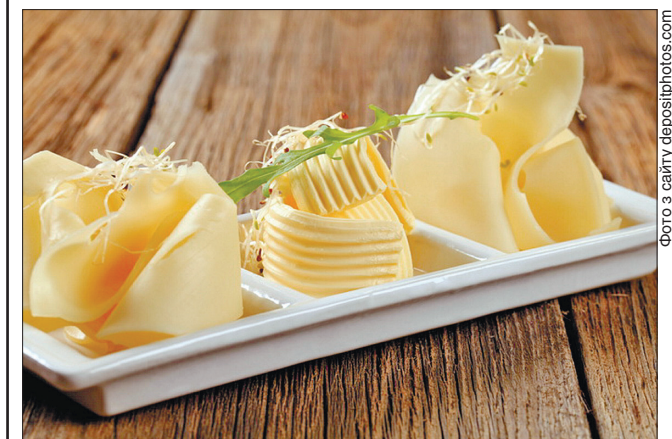
Насичені жири полегшують перебіг панкреатиту

Цю інформацію вдалося підтвердити в досліді за мишами. Тварин з панкреатитом тримали на дієті з насиченими або на дієті з ненасиченими жирами, і перші переносили панкреатит легше, ніж другі. Подальші експерименти показали, що насичені жири гірше розщеплює один з ферментів підшлункової залози. Саме тому підшлункова в разі запалення почувається краще.