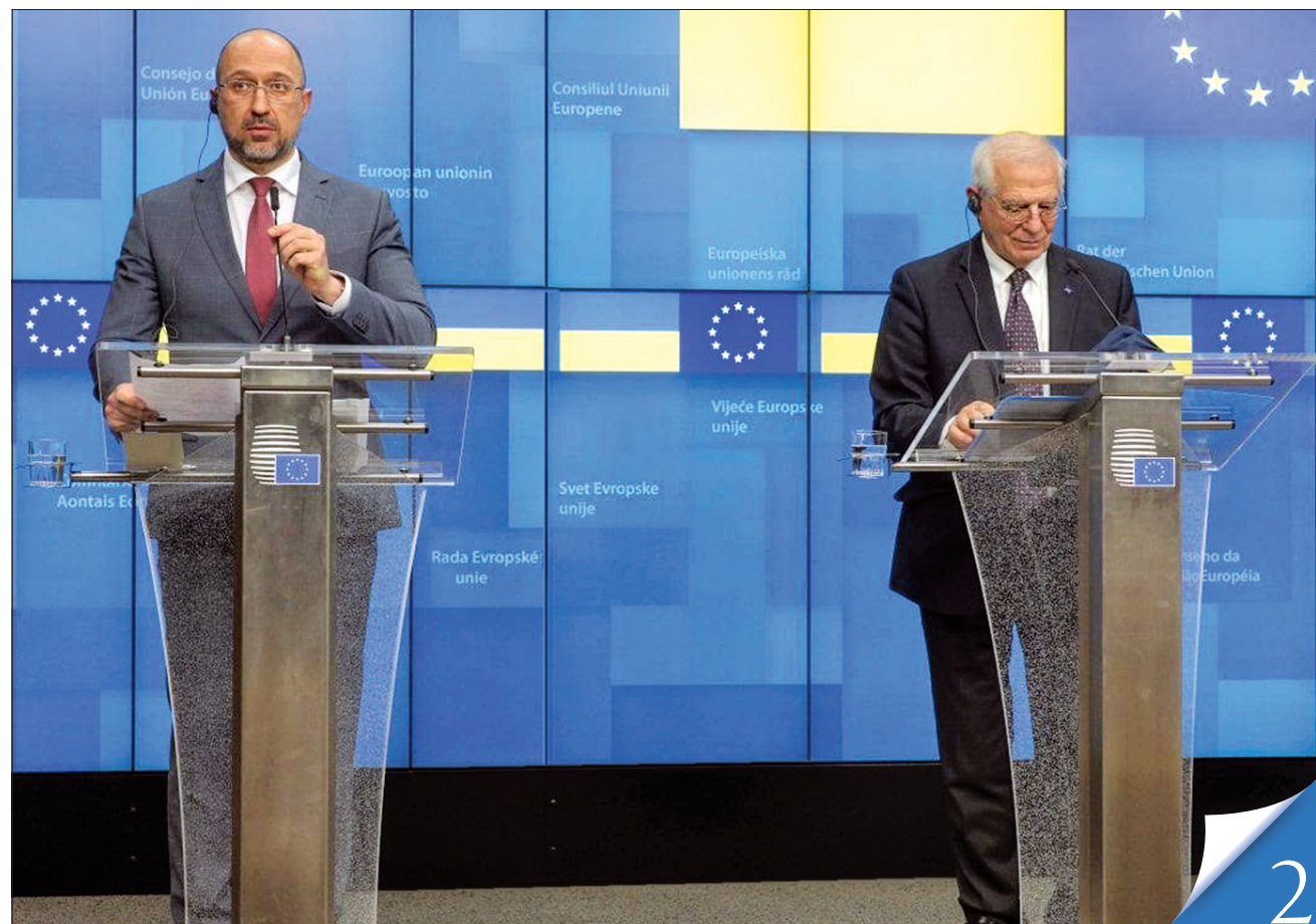
Верховний представник ЄС із питань зовнішньої та безпекової політики Жозеп Боррель (праворуч): «Партнерство з Україною — одне з найважливіших серед тих, які ми маємо з будь-якою країною світу»

КУРС — БЕЗАЛЬТЕРНАТИВНИЙ. Прем'єр-міністр Денис Шмигаль поділився на своїй сторінці у фейсбуці враженнями й підсумками візиту української делегації до Брюсселя та Люксембургу