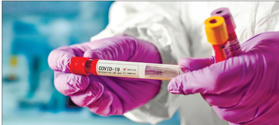
Є перші дані про те, що британський штам може виявитися більш летальним — в середньому на 30%

Здатність витримувати безліч мутацій у всіх вірусів різна. Наприклад, ВІЛ мутує дуже швидко, тому імунна система майже не може його дістати і проти нього досі немає вакцини. SARS-CoV-2 на таку мінливість не здатний, однак важливо знати, як він змінюється, чи є закономірності в тому, як з'являються нові його штами.