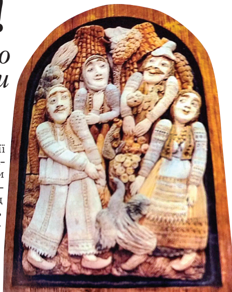
Життя у всіх проявах зображено у керамічних виробах