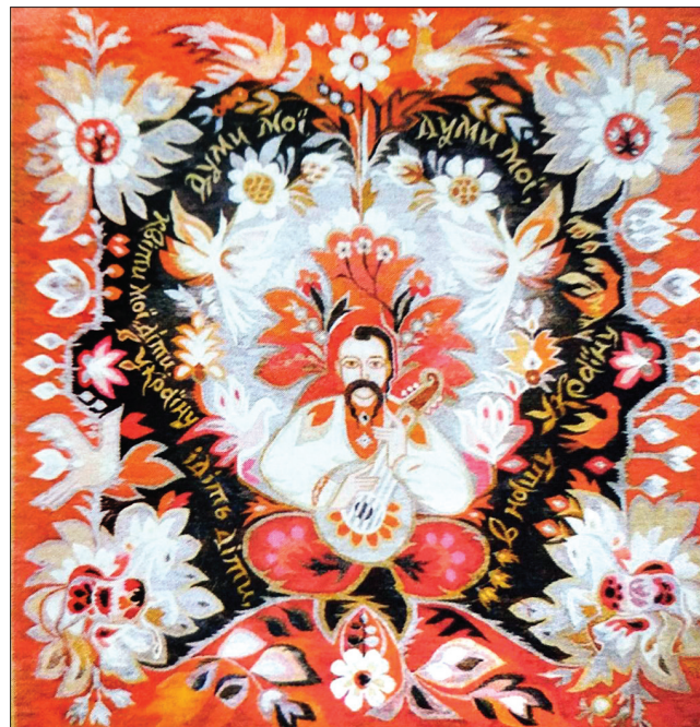
Буяння квітів та рослин обов'язкове у вовняних килимах Полтавщини

лівки». Квітуха Полтавщина — душа України, яка зберігає архетипи істини, правди, добра, краси та любові. У Решетилівці розквітають таланти вихованців місцевого художнього ліцею. Гагтовані їхніми руками рушники і святкове вбрання, виткані гобелени і килими — яскравий літопис національного мистецтва. За 80 років існування навчального закладу шедеври решетилівських майстрів стали одним з попу-