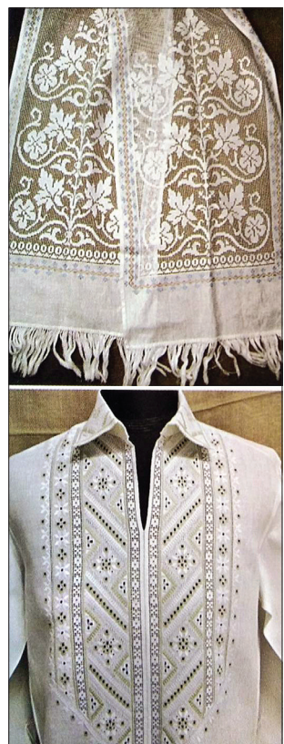
Решетилівська вишивка «білим по білому» — витончений натяк на чистоту душі українців

Тему виховання красою Галина Сагач поетизовано розкриває у нарисі «Благословенне мистецтво Решетилівки».