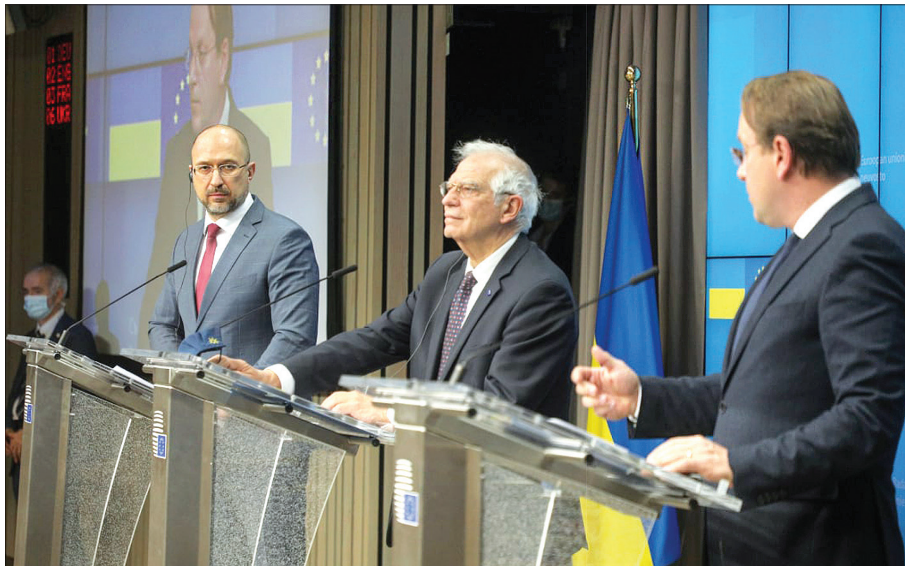
Прем'єр-міністр Денис Шмигаль, Верховний представник ЄС із закордонних справ та політики безпеки Жозеп Боррель, Єврокомісар з політики сусідства та розширення Олівер Варгей засвідчили подальше зміцнення економічної інтеграції України з ЄС на основі Угоди про асоціацію

ЄВРОІНТЕГРАЦІЯ. У ЄС задоволені темпами перетворень в Україні в межах Угоди про асоціацію, але нагадують, що вони не матимуть успіху без ефективної судової реформи