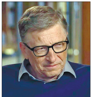
Ще 2015 року Білл Гейтс передбачив пандемію

Друга загроза — біотероризм, вважає мультимільярдер: «Хтось, хто захоче завда-