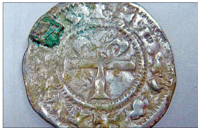
Ця монета існує тільки в одному екземплярі

«У старовинній книзі йдеться, що така монета була в одній із приватних колекцій, але з 1790 року ніхто її не бачив. Деякі нумізмати вважали, що її зовсім не існувало, а автори щось переплутали. Але тепер у нас є екземпляр цієї рідкісної монети, знайдений у Швеції», — зазначив професор Єнс Крістіан Мосгаард.