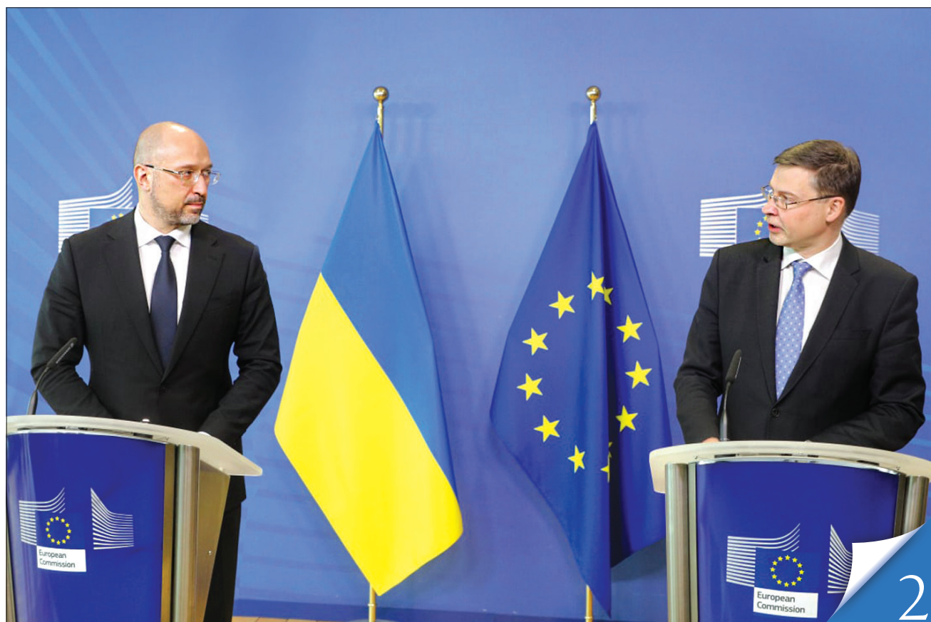
Виконавчий віцепрезидент Європейської комісії Валдіс Домбровскіс (праворуч): «ЄС підтримує Україну на її європейському шляху»

ЄВРОІНТЕГРАЦІЯ. ЄС готовий сприяти економічному зближенню з Україною. Але нагадує, що від успіху антикорупційної реформи залежатиме подальший успіх євроінтеграції