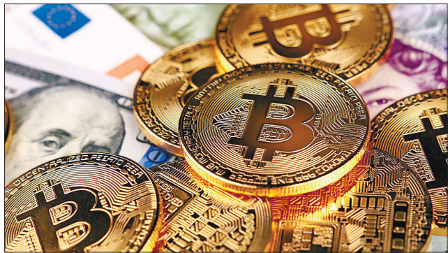
Біткоїн подорожчав майже до 45 тисяч доларів США

«У січні 2021 року ми оновили нашу інвестиційну політику, щоб отримати змогу для подальшої диверсифікації та збільшення прибутку від коштів, які не потрібні для підтримання достатнього рівня ліквідності»