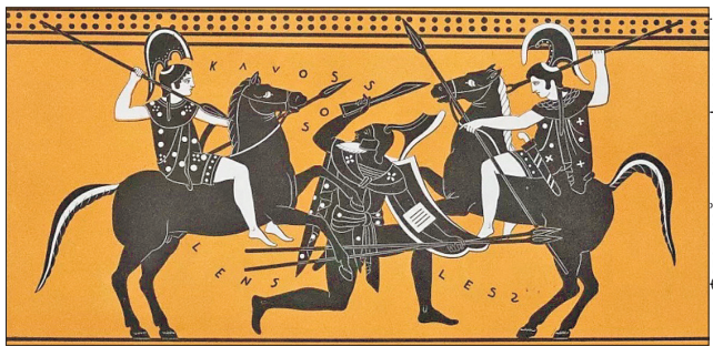
На ілюстрації зображено амазонок у бою

Спочатку сучасні історики вважали, що амазонки, вперше описані Гомером у VIII столітті до нашої ери, — вигадані персонажі. Однак наприкінці XX століття археологи стали вивчати скелети жінок, поховані в місцях проживання скіфів. На деяких з них експерти знайшли сліди бойових травм: наприклад, наконечники стріл у кістках. Багато жінок було поховано зі зброєю, яка нагадувала зображення амазонок у давньогрецькому мистецтві.