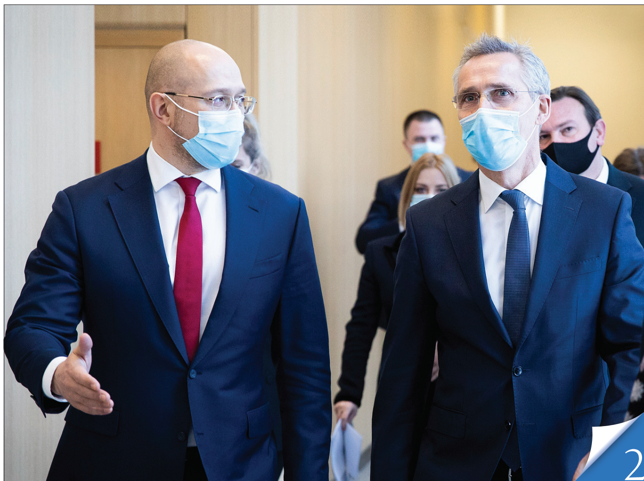
Генсек НАТО Єнс Столтенберг (праворуч) позитивно оцінив переговори з Прем'єр-міністром Денисом Шмигалем

ГЕОПОЛІТИКА. Північноатлантичний альянс тримає двері для України відчиненими і радіє взаємовигідному партнерству