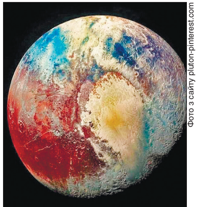
Маса Плутона менша за масу Місяця майже вшестеро

Вважають, що планети народжуються внаслідок акреції (падіння речовини на космічне тіло із зовнішнього середовища) протопланетного диска навколо молодої зірки. Але Плутон, як припустили науковці, міг з'явитися іншим шляхом, тому що склад карликової планети дуже схожий на склад комети Чурюмова-Герасименко. Співробітники Південно-західного науково-дослідного інституту в Техасі вважають, що Плутон — своєрідне гігантське звалище комет.