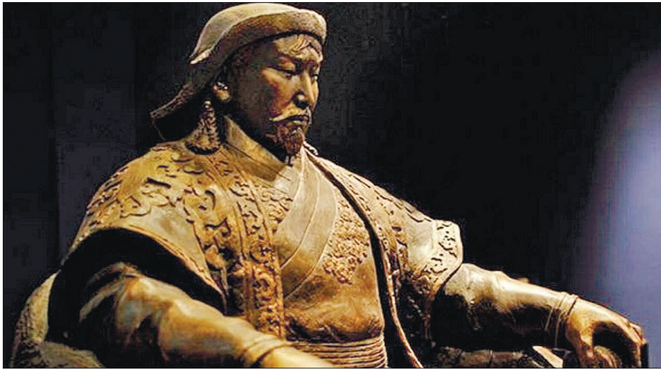
Чингісхан у бронзі

Чингісхан, народжений 1162 року як Темучжин із клану Борджигін, був одним з найвідоміших завойовників у світовій історії. 1206-го він заснував Монгольську імперію і став першим її правителем. На час його смерті 1227-го територія його імперії була в 2,5 рази більша за площу Римської. Хоч історія життя великого монгола добре відома, його смерть оповита таємницею. За словами науковців, членам сім'ї та послідовникам Чингісхана було наказано зберігати в секреті місце розташування його могили.