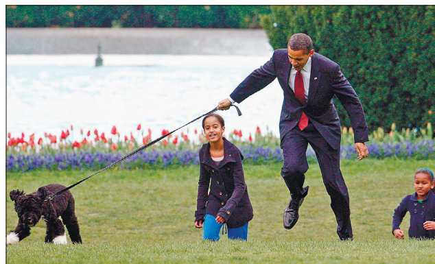
Президент США Барак Обама з доньками вигулює собаку. 2009 рік