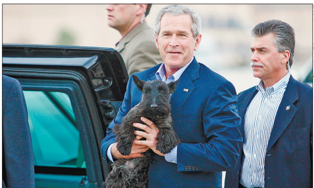
Президент США Джордж Буш зі своїм собакою. 2006 рік

Меган переїхала в Лондон у листопаді 2017 року. У зв'язку з цим вона могла б почати процедуру отримання британського громадянства в листопаді 2020-го. Експерти уточнюють, що протягом цього періоду допустимо перебування за межами Великої Британії протягом не більш як 270 днів, однак Меган не вдалося впоратися із цією вимогою.