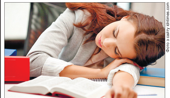
Мозок відпочиває під час короткого денного сну

Тривале дрімання посеред дня може порушити внутрішній годинник організму, спричинивши своєрідний збій. Тоді може порушитися режим дня, що стає причиною появи неконтрольованого відчуття голоду, порушення сну та нестачі енергії.