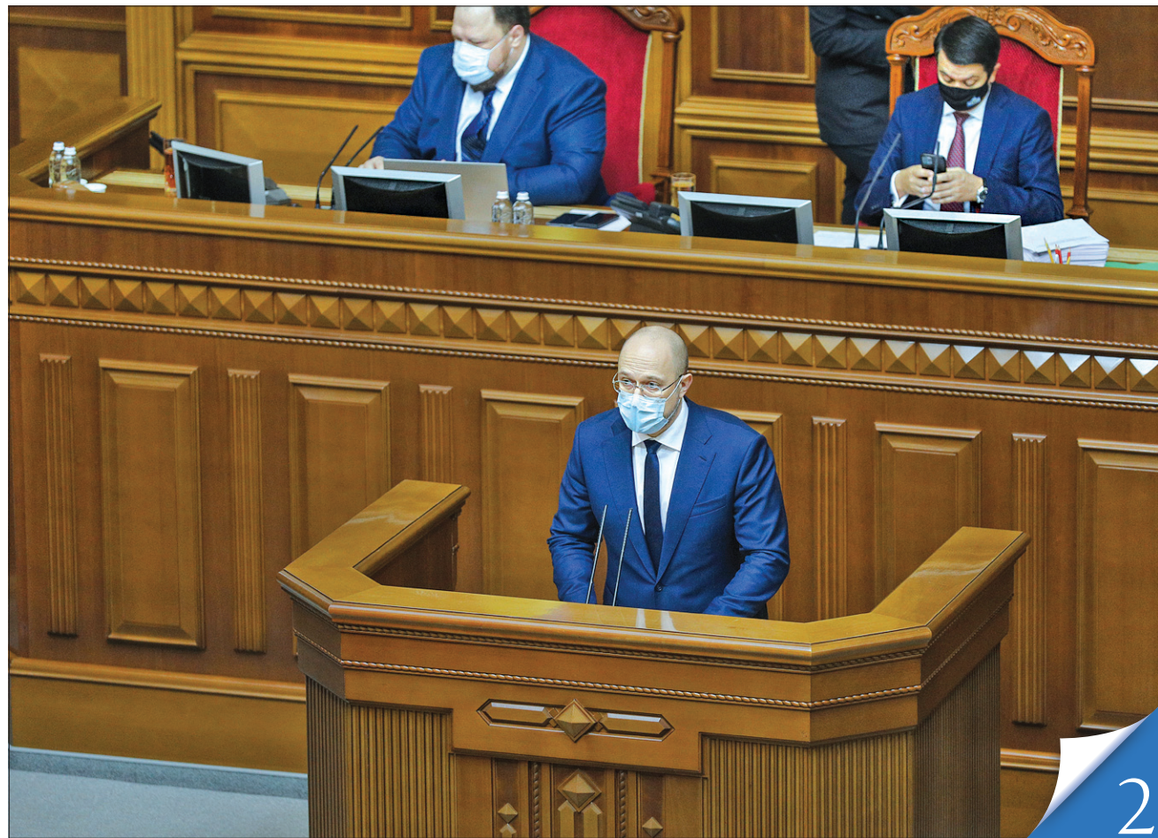
Цього тижня Прем'єр-міністр Денис Шмигаль двічі звітував у Верховній Раді щодо актуальних питань, які найбільше турбують суспільство

КОМАНДНА РОБОТА. Парламент перерозподілив на ці потреби з бюджету 1,4 мільярда гривень