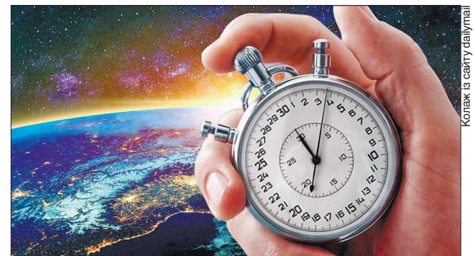
Земна доба в середньому поменшала на 0,5 секунди

Із 1970-х було додано загалом 27 додаткових секунд, щоб атомний час відповідав сонячному. Річ у тому, що супутники і комунікаційне обладнання покладаються на точний збіг часу із сонячним, який визначається положенням зірок, Місяця і Сонця. Щоб зберегти це, хронометристи паризької Міжнародної служби обертання Землі раніше додавали до дня так звані додаткові секунди. Востанне це відбулося в переддень нового 2016 року.