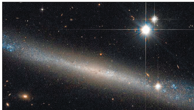
Як знайти срібну голку в копиці космічного сіна знає телескоп Hubble, який зробив зображення спіральної галактики IC 2233, однієї з найбільш плоских відомих галактик, повідомляє NASA

червоної астрономії (NOIRLab). Галактика IC 2233 розташована на відстані приблизно 40 мільйонів світлових років від Землі в напрямку сузір'я Риси. Вона відносно спокійна і має низьку швидкість зореутворення, формуючи світила у 20 разів повільніше, ніж Чумацький Шлях. Тривалий час вважали, що галактика IC 2233 взаємодіє із сусідньою карликовою галактикою NGC 2537. Однак тепер це вважають вкрай малоімовірним. Спостереження, проведені 2007 року, показали, що галактики не взаємодіють у парі і, ймовірно, розташовані на різ-