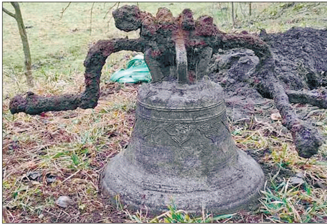
Дзвін, який знайшли у селі Заруддя на Тернопільщині

Цікаво, що один із дзвонів місцеві греко-католики зі своєї церкви перенесли до дзвіниці костелу. Кажуть, голосно лунав, аж на чотири села його було чути.