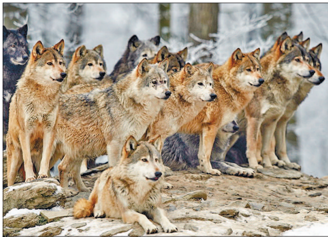
У вовчій зграї може бути 25 і більше вовків

Доросла самиця сірого вовка (без цуценят) з цен-