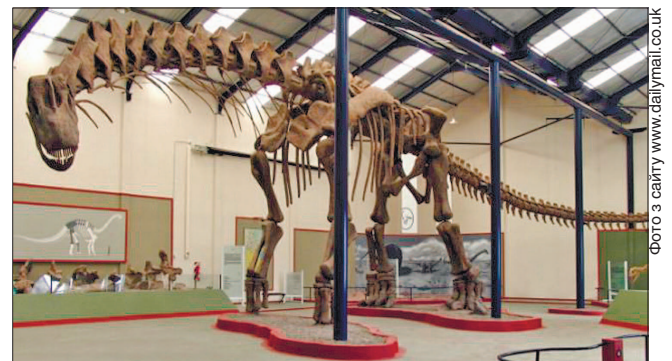
Реконструкція скелета аргентинозавра завдовжки 40 метрів

Раніше вважали, що патаготитан (рід титанозаврових) — один з найбільших представників тварин, які жили на Землі мільйони років тому. Доктор Грегорі Пол виявив, що розміри кісток аргентинозавра набагато більші, ніж у патаготитана. «Головний висновок мого аналізу полягає в тому, що патаготитан — не найбільший відомий титанозавр», — цитує Пола Syfy Wire. Вага аргентинозавра — приблизно 80 тонн, а патаготитан важив 50—55 тонн. Тобто вага найбільшої сухопутної тварини — майже 13 африканських слонів. Такі величезні травоядні мали щодня з'їдати кілька дерев, щоб жити. Найвища швидкість, якої вони могли досягти, була не більшою за 24 км/год. Однак науковець зазначив, що вже знайдено рештки інших зауроподів, які могли бути більшими аргентинозавра.