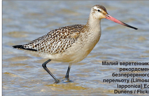
Малий веретенник, рекордсмен безперервного перельоту ( Limosa lapponica )

Самець, відомий орнітологам як 4BBRW (це означає, що дослідники позначили його лапи двома синіми, червоним і білим кольоровими кільцями, які полегшують ідентифікацію окремих птахів) вилетів із Західної Аляски 16 вересня 2020 року, а через 11 діб потім вже був у Новій Зеландії, в одній з бухт в околицях Окленда. Спочатку кулик подолав ланцюжок Алеутських островів, після цього рухався над Тихим океаном на південний захід і звернув на