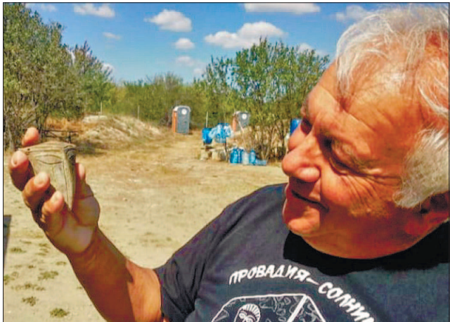
Експерт доісторичної археології професор Василь Ніколов демонструє глиняну маску V тисячоліття до н.е.

Стародавня Провадія процвітала. Тамтешні жителі розбагатіли, добуваючи кам'яну сіль і торгуючи нею навіть з найвіддаленішими регіонами протягом приблизно чотирьох тисячоліть.