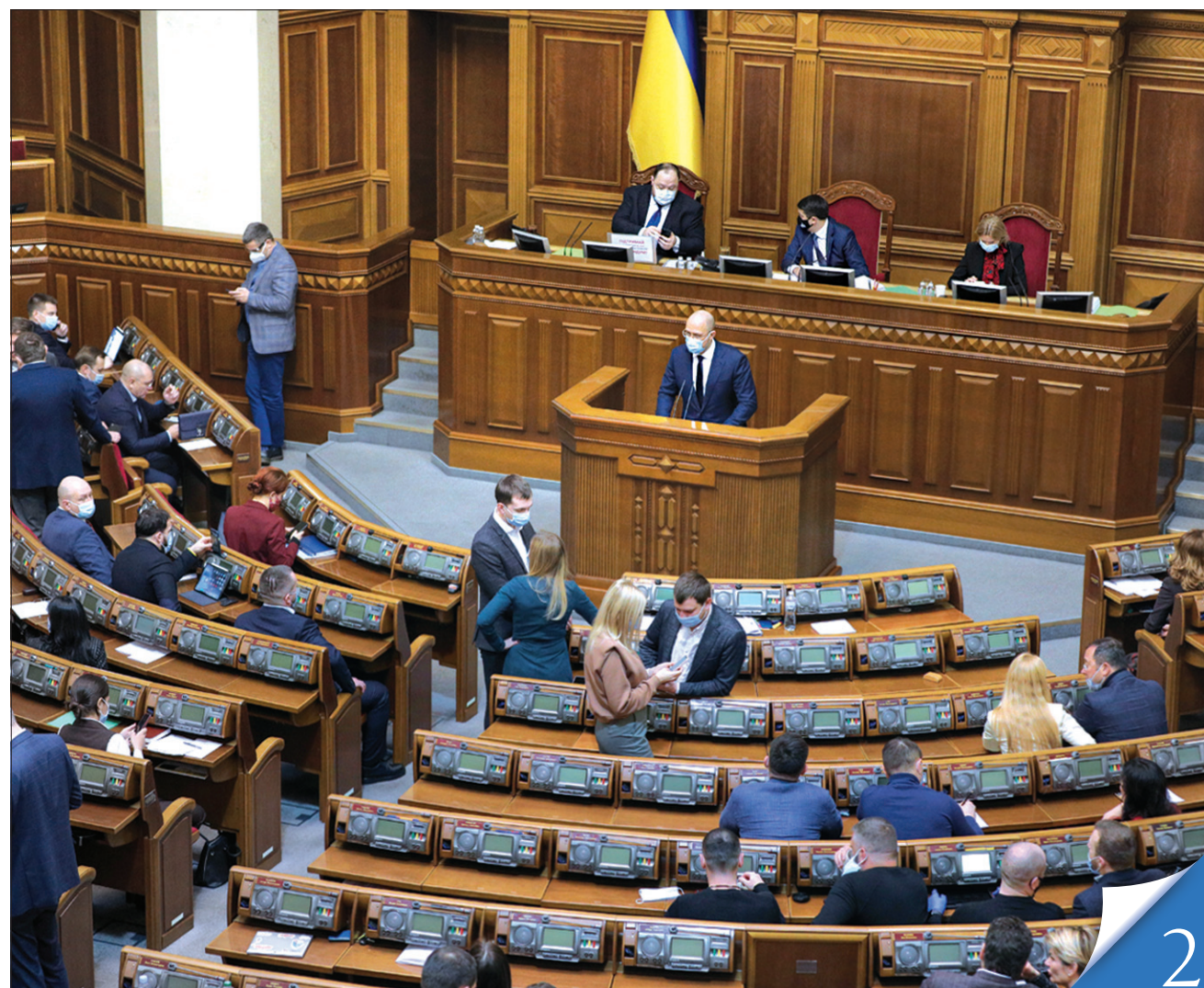
Прем'єр-міністр Денис Шмигаль представив народним депутатам візію уряду щодо найактуальніших питань цього опалювального сезону

бюджетних коштів перерозподілив уряд для забезпечення видатків, пов'язаних з ліквідацією районів