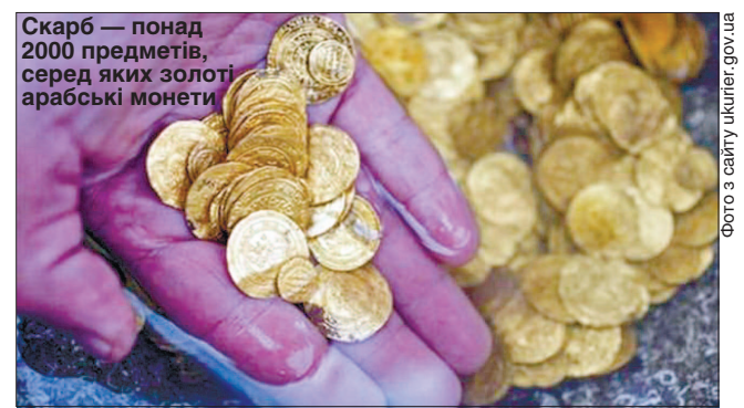
Скарб — понад 2000 предметів, серед яких золоті арабські монети

Фахівці припускають, що монети опинилися на морському дні після корабельної аварії. Імовірно, на дно пішло судно, яке прямувало до Єгипту. Можливо, що монети було призначено для виплат військовому гарнізону, який захищав Кесарію від ворогів. Є й інша теорія, згідно з якою скарб був на великому торговому кораблі, який вів справи з прибережними містами і портом у Середземному морі. «До того, як знайти монети, ми й гадки не мали, що громада в Кесарії в той час була такою великою і багатогою. Тож це змінило наші уявлення про той час», — кажуть науковці.