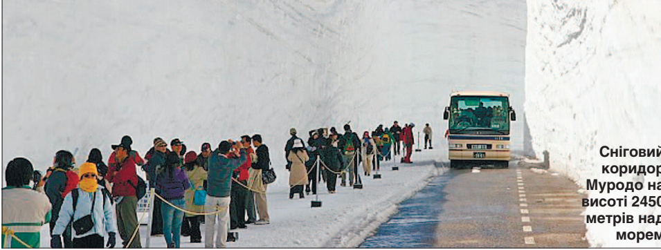
Сніговий коридор Муродо на висоті 2450 метрів над морем

ських готелів. Адже історичних і природних пам'яток у цих місцях теж не бракує. Наприклад, гори Татеяма і Акасавадаке, гребля Куробе, храм Ояма, прогулянкові зони Мідагахара тощо.