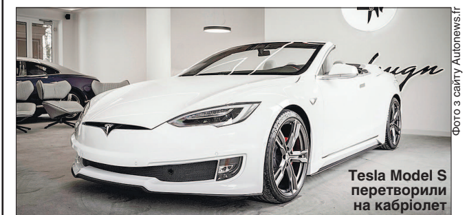
Tesla Model S перетворили на кабриолет

Нині в офіційній лінійці компанії Tesla немає машин з відкритим кузовом. Першою серійною моделлю американської марки був кабриолет Roadster, який виробляли з 2008-го по 2012 рік. У Tesla є план розроблення автомобіля нового покоління з такою самою назвою, проте, як очікують, він буде із закритим кузовом. Прототип цієї моделі, показаний восени 2017 року, представили як купе.