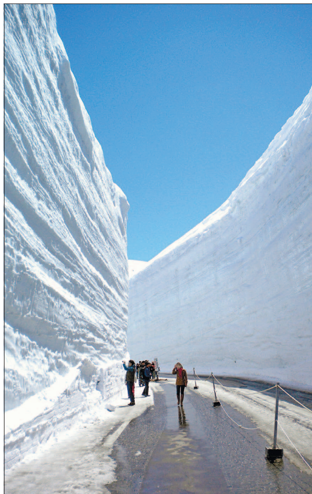
Снігові стіни Татеяма-Куробе

Для туристів цей маршрут відкрили 1971 року. А греблю Куробе — одну з головних фішок траси — побудували в горах за вісім років до цього.