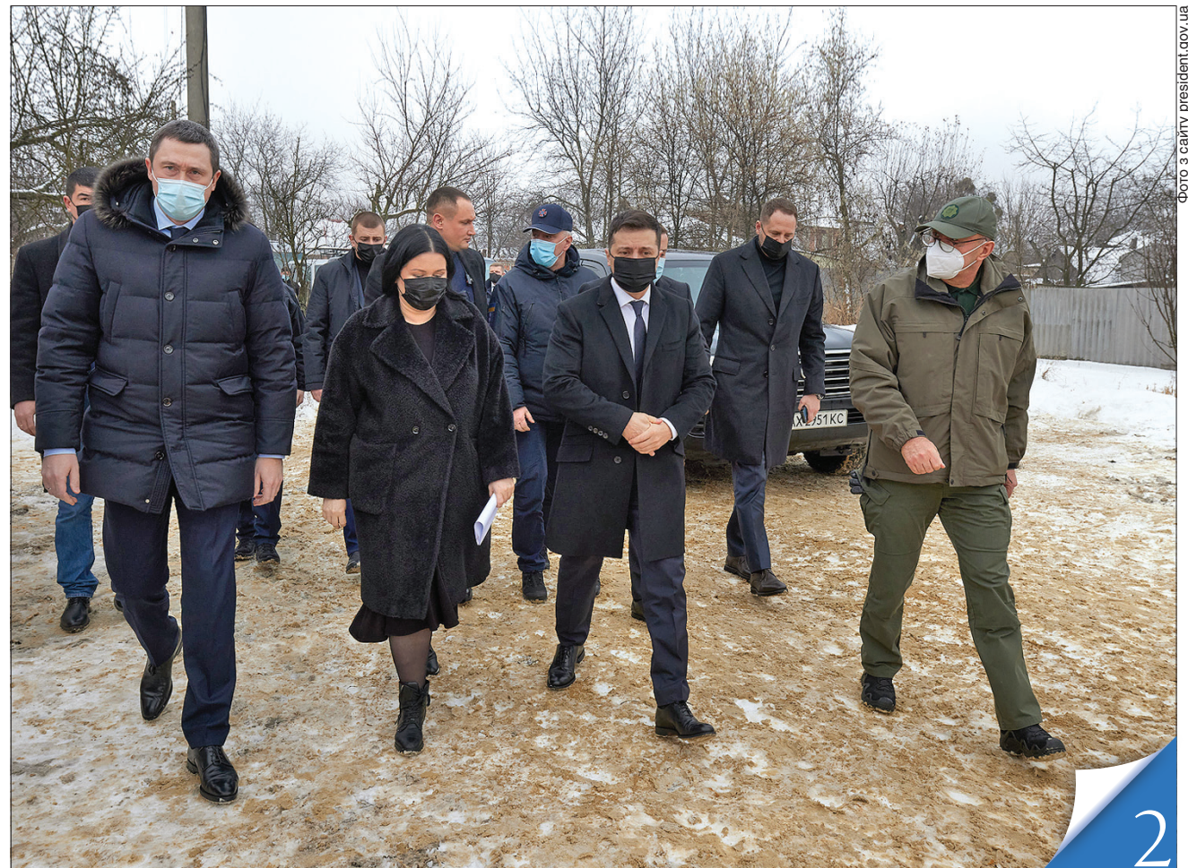
Учора Президент терміново полетів на Харківщину і провів нараду з представниками місцевої влади

НАДЗВИЧАЙНА СИТУАЦІЯ. Через загибель у пожежі в Харкові 15 людей Президент оголосив сьогодні всеукраїнський день жалоби