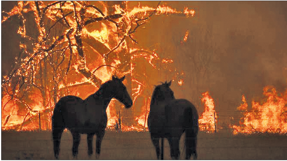
За оцінками екологів, від лісових пожеж в Австралії загинуло 480 мільйонів тварин. Австралійські фермери втратили багато худоби, їм довелося евакуювати тварин, які постраждали від опіків