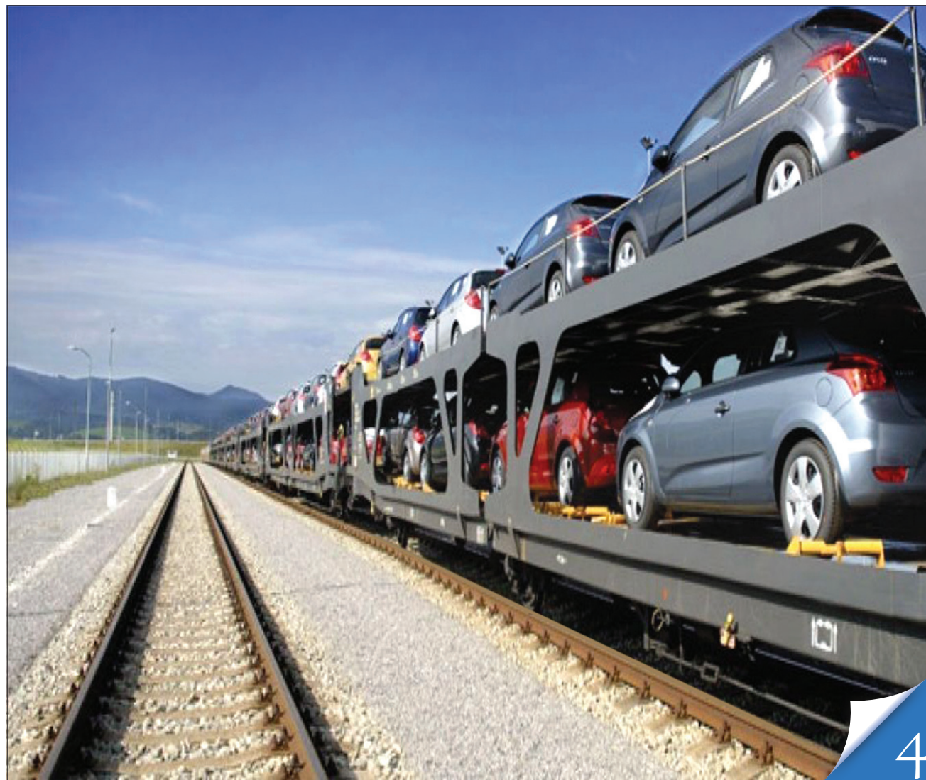
Легковики ввозимо, а тролейбуси, автобуси й іншу техніку могли б і вдома робити