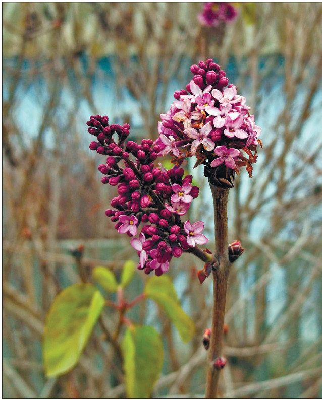
У Миколаєві розцвів бузок