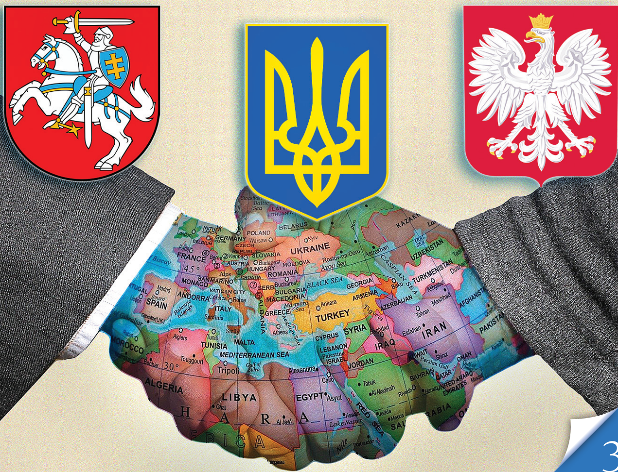
«Люблінський трикутник» (Україна, Польща, Литва), створений цьогоріч, — перша ластівка нового мережива, яке єднати нашу країну з прогресивним Заходом

ОРІЄНТИРИ. Переконавання нашої молоді створюють вагомий запас міцності і впевненості в цивілізаційному виборі країни