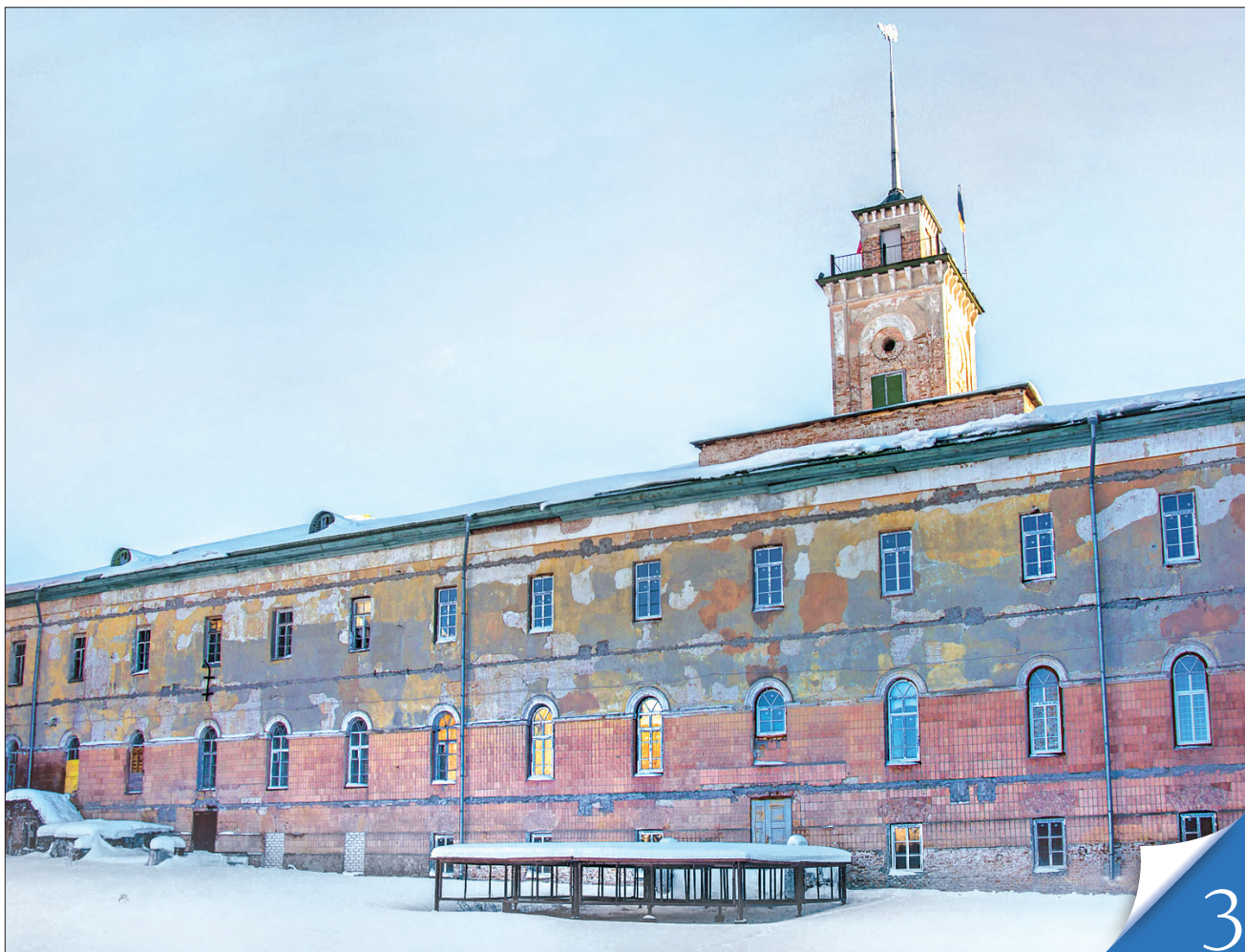
Штаби військових поселень у Чугуєві, як і музей-садиба відомого на весь світ художника Іллі Рєпіна, стануть привабливим туристським об'єктом Харківщини

СПАДЩИНА. Щоб урятувати пам'ятку архітектури державного значення XIX століття штаби військових поселень у Чугуєві, Харківська обласна рада ініціює їх передачу до спільної власності територіальних громад