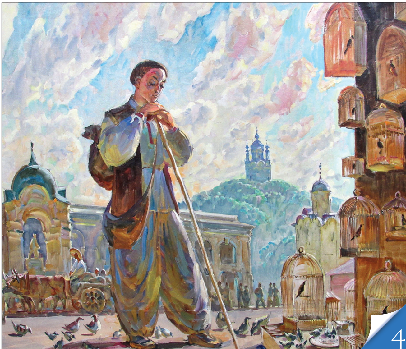
Одна з картин циклу «Основи» заслуженого художника України Генрі Ягодкіна, який з юності захопився особистістю Григорія Сковороди, відтворює тернистий шлях і становлення мислителя світового рівня

НАБЛИЖАЮЧИСЬ ДО ЮВІЛЕЮ. Сьогодні минає 298 років із дня народження видатного українського філософа, поета, педагога, просвітителя