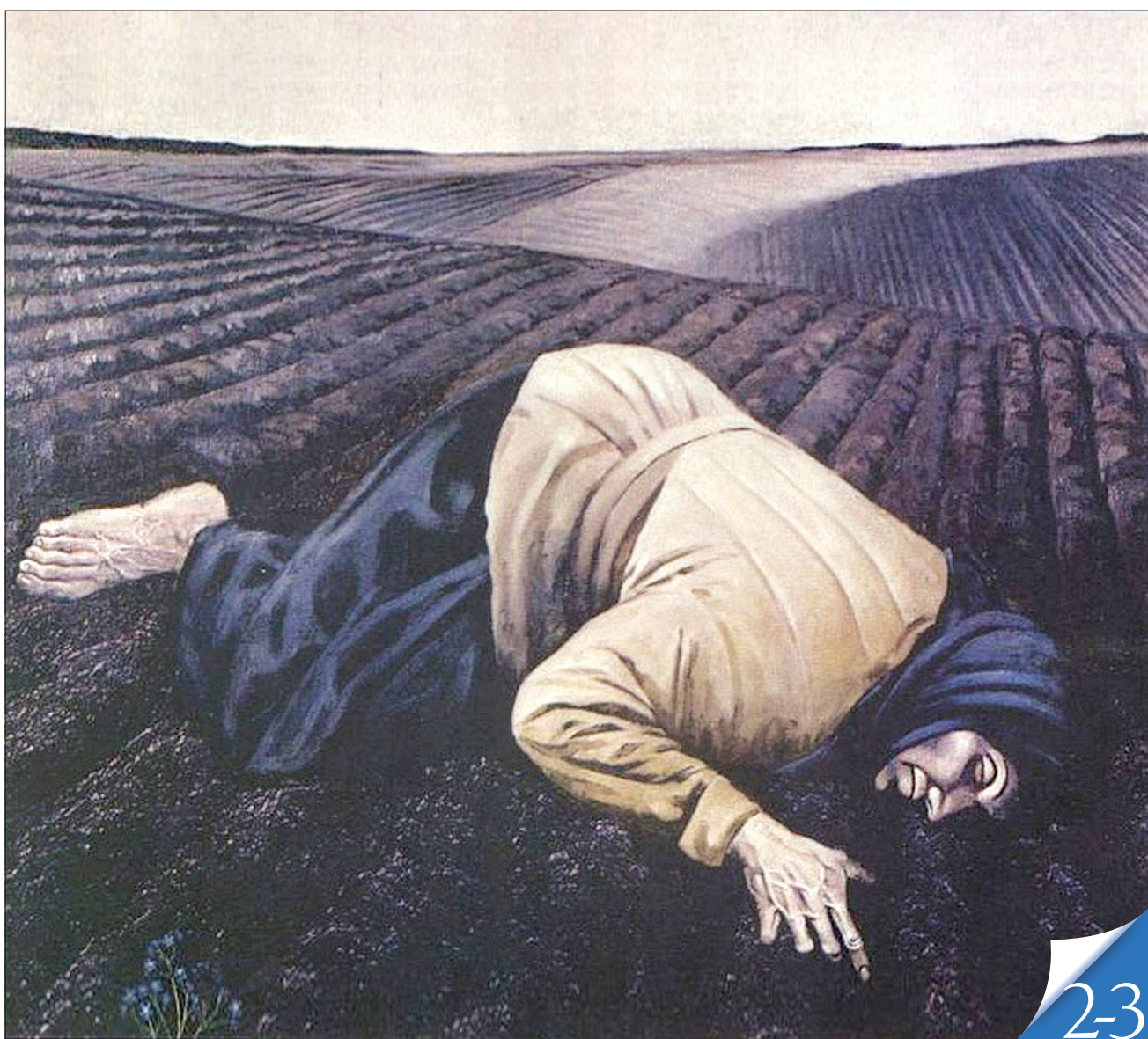
Фоторепродукція з сайту volart.com.ua/Земля. Робота ПЕВНОГО Богдана (1963)

ВІЧНА ПАМ'ЯТЬ. 28 листопада в Україні вшановують жертв однієї з масштабних, цинічних, жахливих і потворних трагедій у вітчизняній історії — людомору