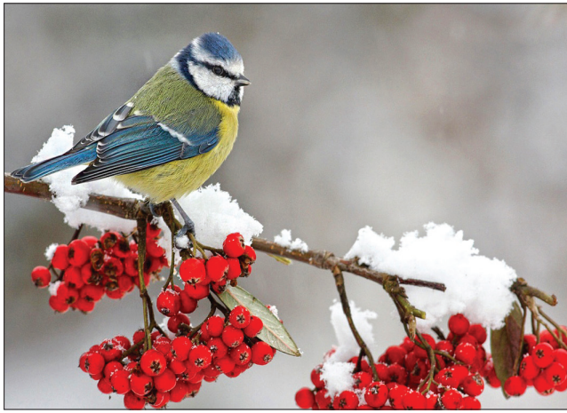
«...Й гілка невеличка, де живе-зимує чепурна синичка»

Погодні умови на наступні зимові місяці, весну та літо прогнозуватимемо, беручи до уваги народні прикмети. Старі люди здавна спостерігають за ними у такі дні грудневих релігійних свят: Платона та Романа (1), Третя Пречиста (4), Катерини (7), Андрія Первозваного (13), Миколая Чудотворця (19).