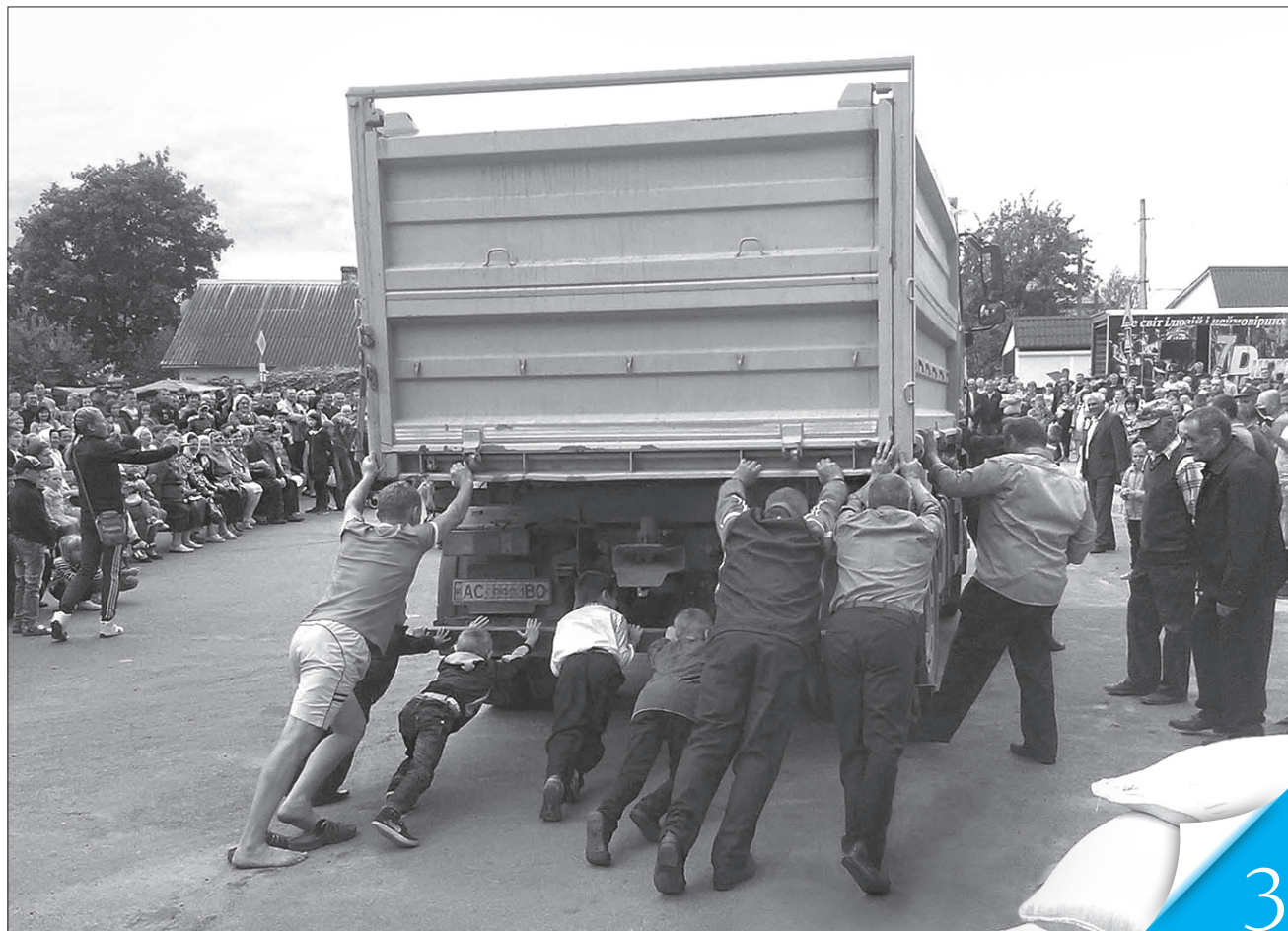
На успіх реформи мають злагоджено працювати владні інституції різних рівнів

ДЕЦЕНТРАЛІЗАЦІЯ. Щоб не допустити розбалансування нашого звичного життя, необхідно терміново ухвалити відповідне законодавство