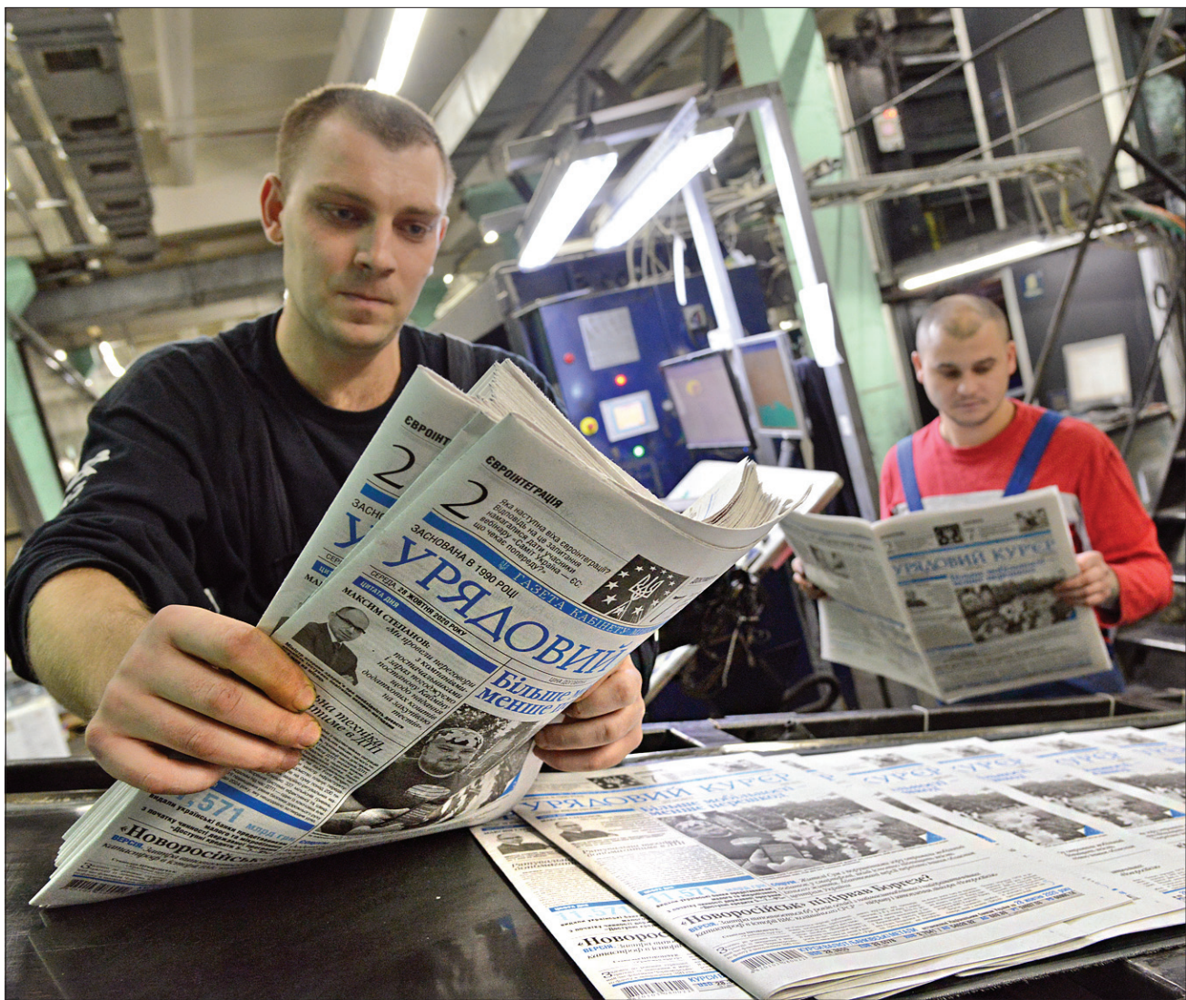
Наша газета одна з небагатьох у країні, що виходить п'ять разів на тиждень

3 ДНЕМ НАРОДЖЕННЯ! Сьогодні «Урядовий кур'єр» відзначає вихід першого номера