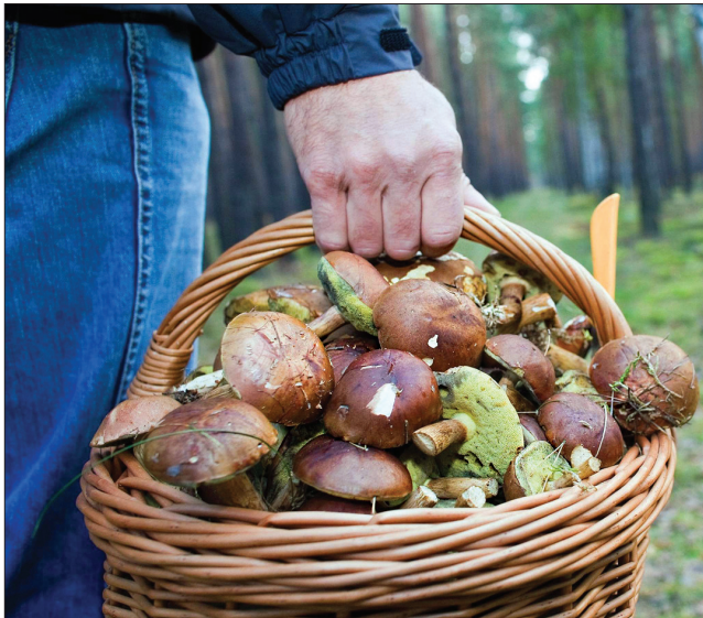
Під час посту смакуйте страви з грибами

Від Дмитра на землі господарює зима. Якщо цього дня випаде сніг, холодатиме до кінця місяця. Дощ