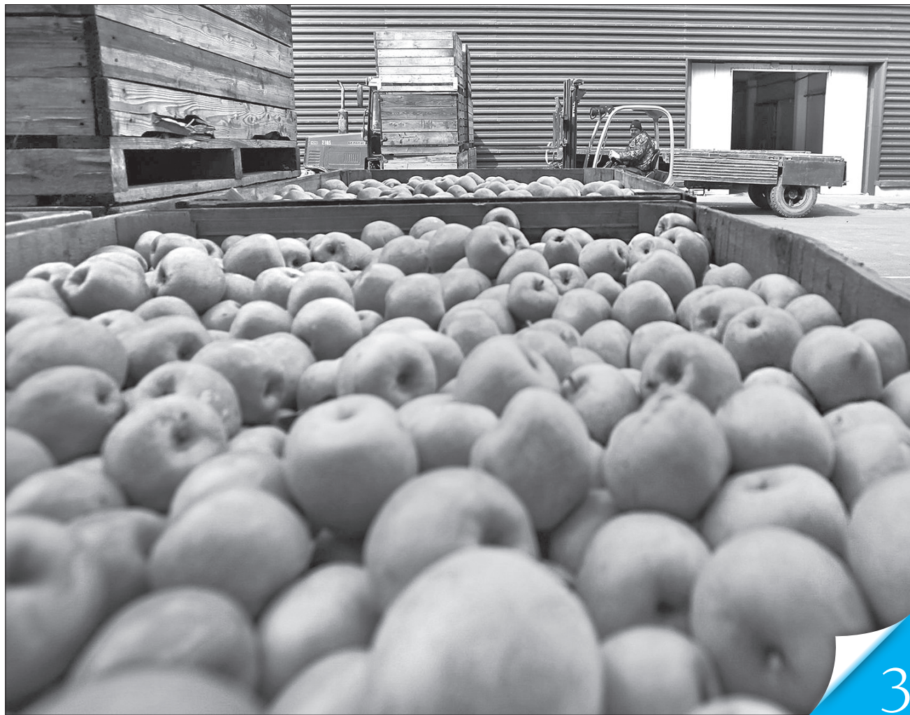
Українські виробники яблук більше не хочуть втрачати експортних можливостей

ЗОВНІШНЯ ТОРГІВЛЯ. Компанії-експортери нарікають, що держава мало допомагає їм у просуванні товарів за кордон