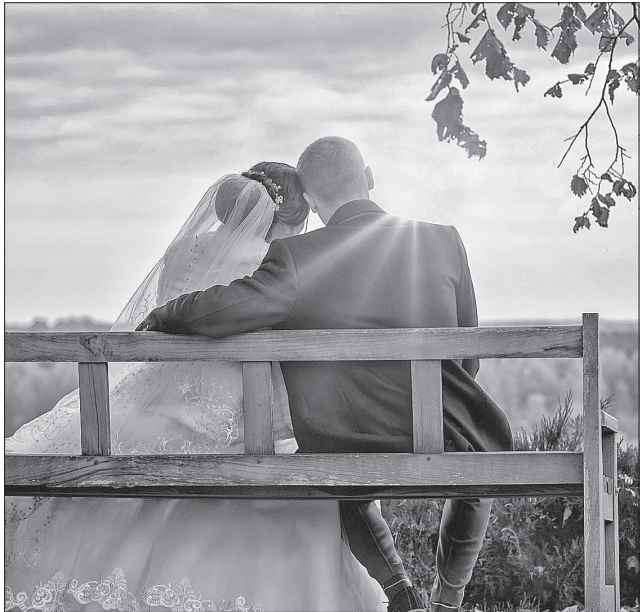
Осінь — час весіль, адже щастя не відкладеш через пандемію і карантин

На Трохи́ма пасічники готують своє бджолине господарство до зими — переносять вулики в теплі примі-