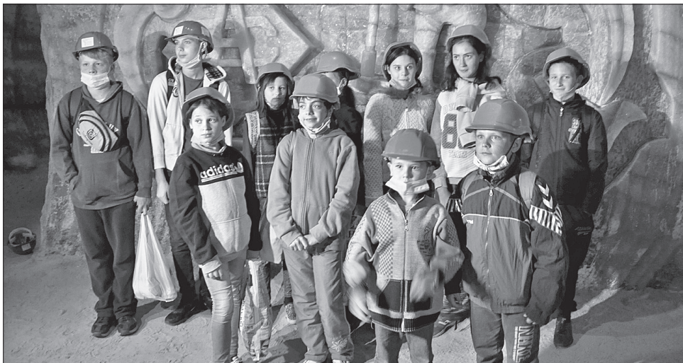
Діти війни обживаються в «Соляній симфонії»

«Урядовий кур'єр» став інформаційним партнером цього проєкту. Ми вже розповідали, що його впроваджують із липня з ініціативи автора книжки за підтримки командувача Об'єднаних сил ЗСУ Сергія Наєва, Національної спілки журналістів, ДП «Артемсіль» та кількох вітчизняних видань, серед яких, окрім «УК», газета «Голос України» та ІА «АрміяІnform».