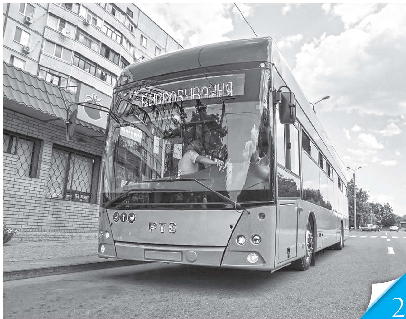
Перший з 50 тролейбусів з автономним ходом почав тестування в обласному центрі

АЛЬТЕРНАТИВА. Реформування громадського транспорту вкрай необхідне великим українським містам. Як це роблять у Харкові?