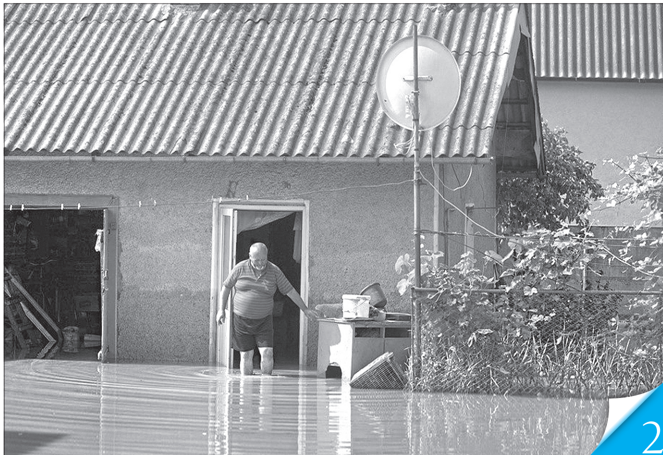
Уряд виділив сім'ям, житлові будинки яких пошкоджено, по 20 тисяч гривень

ДЕРЖАВНА ПІДТРИМКА. Контроль за цільовим використанням ресурсу буде жорстким