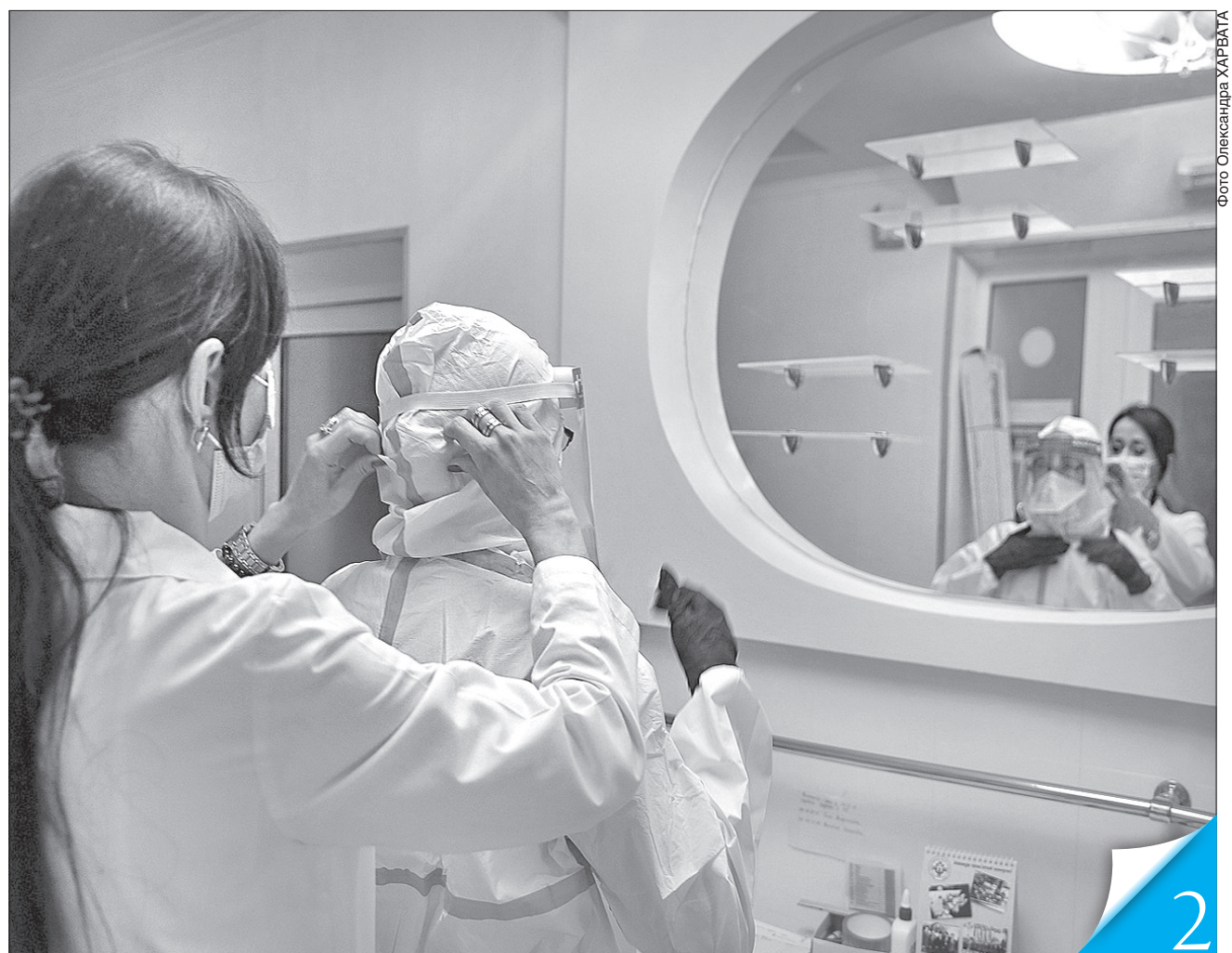
У повній амуніції працювати нелегко, але по-іншому не можна

COVID-19. Медики Рівного найбільше бояться італійського варіанта розвитку пандемії влітку